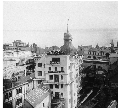
... zum grossräumigen Industriekomplex nach 1900.