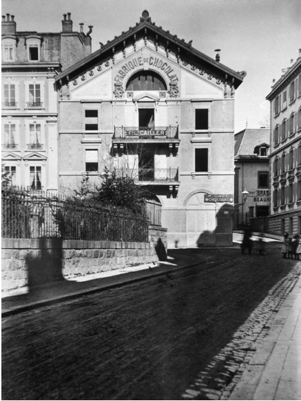
Zu enge Produktionsverhältnisse: Diese 1863 bezogene Fabrik von Cailler in Vevey wurde nach dem Umzug nach Broc 1898 aufgegeben.

kanten im Vergleich zur internationalen Konkurrenz ausmachte, wird in einem zusätzlichen Faktor deutlich: der Schnelligkeit, mit der in einem Jahrzehnt eine ansehnliche Reihe mittelgrosser bis grosser, kapitalmässig gut ausgestatteter Betriebe entstanden und sich auf dem internationalen Markt durchsetzten.