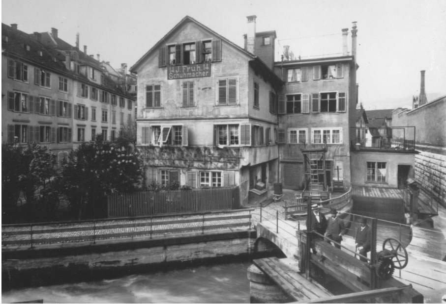
Im kleingewerblichen Werdareal am Sihlkanal in Zürich befand sich eine der ersten Produktionsstätten von Rudolf Sprüngli. Rückseite der Fabrik, um 1869.