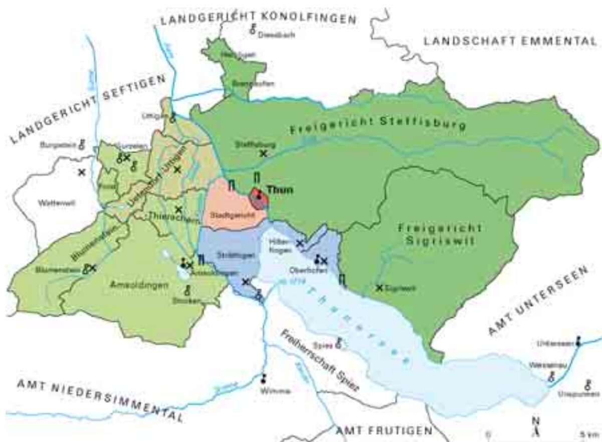
Karte 3: Die bernische Landesverwaltung in der Region Thun des Ancien Régime: Die Stadt Thun und die Ämter Thun und Oberhofen