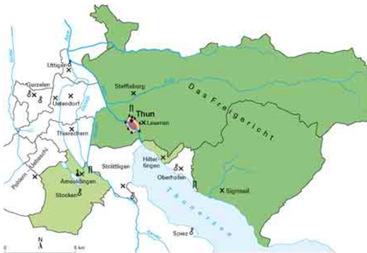
Karte 2: Thun im 15. Jahrhundert: Stadt und Stadtgericht: das Amt des Schultheissen von Thun