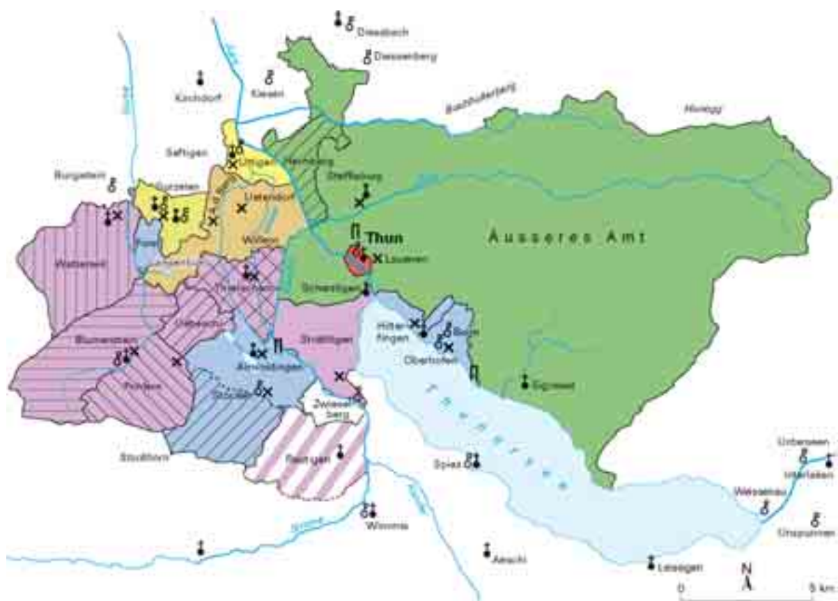
Karte 4: Mittelalterliche und frühneuzeitliche Herrschaften in der Region Thun