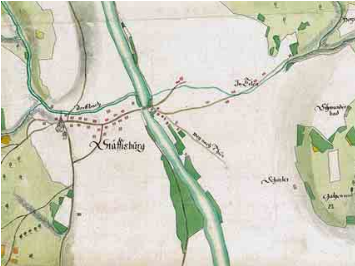
Abb. 1 Die alte Hochgerichtsstätte des Amtes Thun, 1717. Ausschnitt aus dem «Grundriss der gemeinen Allmend, Holtz und Felder, der Gemeind Steffisburg gehörig» von Ingenieur Johann Adam Riediger von 1717. Der Galgen am Galgenrain im Glockenthal (rechts unten) stand in geringer Entfernung vom Landgerichtspratz von Steffisburg beziehungsweise ab 1581 vom Gerichts- oder Landhaus (Gebäude unterhalb des Kirchenbezirks), von wo die zum Tod Verurteilten zur Richtstätte geführt wurden. Der Galgen lag erhöht über dem «Weg nach Thun», nahe bei der Landstrasse von Bern nach Thun: Der weithin sichtbare Zeuge der Gerichts- und Herrschaftsgewalt der Amtsverwaltung Thun sollte Übeltäter vom Betreten des Amtsterritoriums abschrecken.