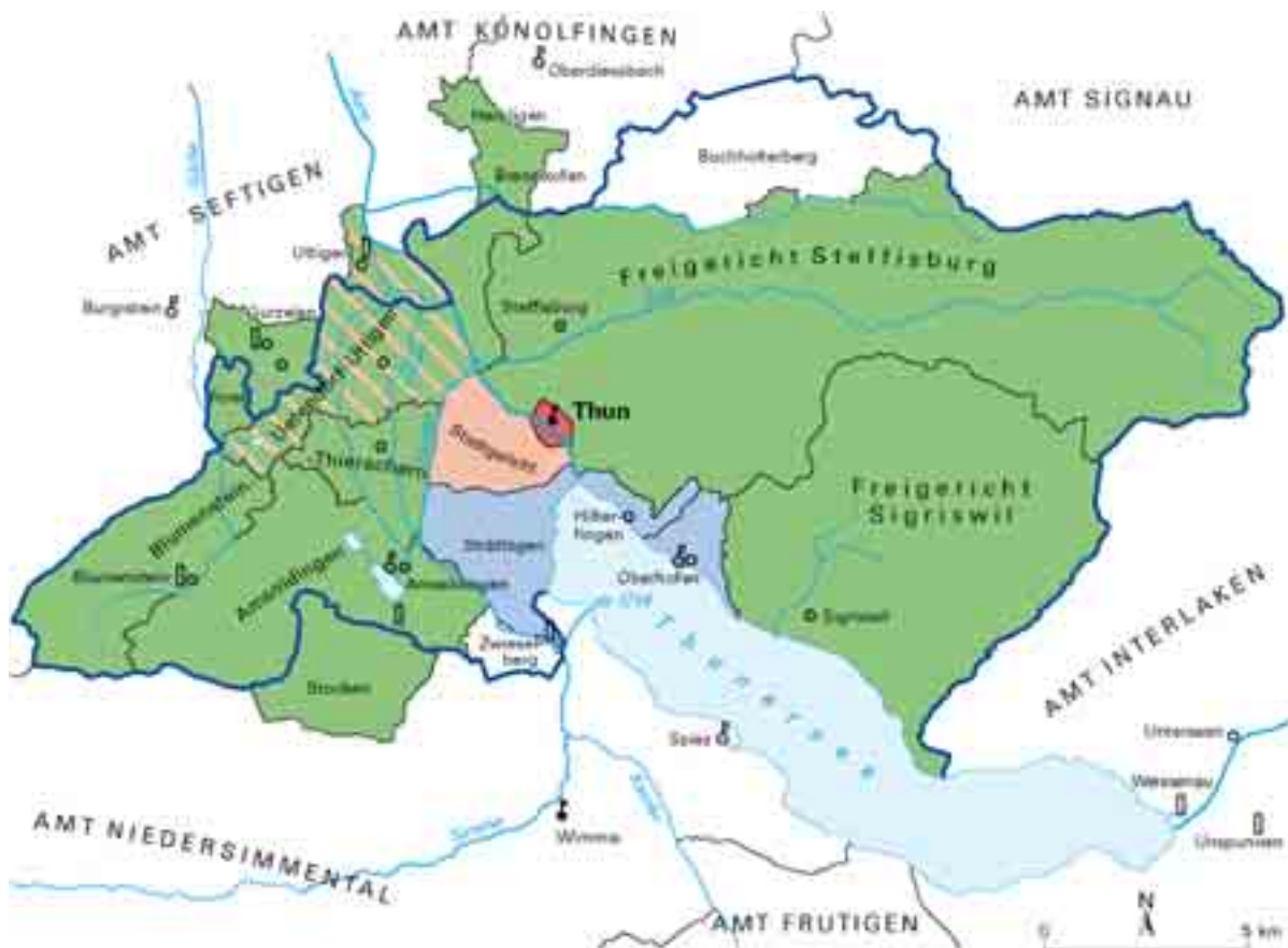
Karte 1: Die Stadt Thun und die Ämter Thun und Oberhofen bis 1798 (Rechtsquellengebiet) im Vergleich mit dem Amtsbezirk Thun heute