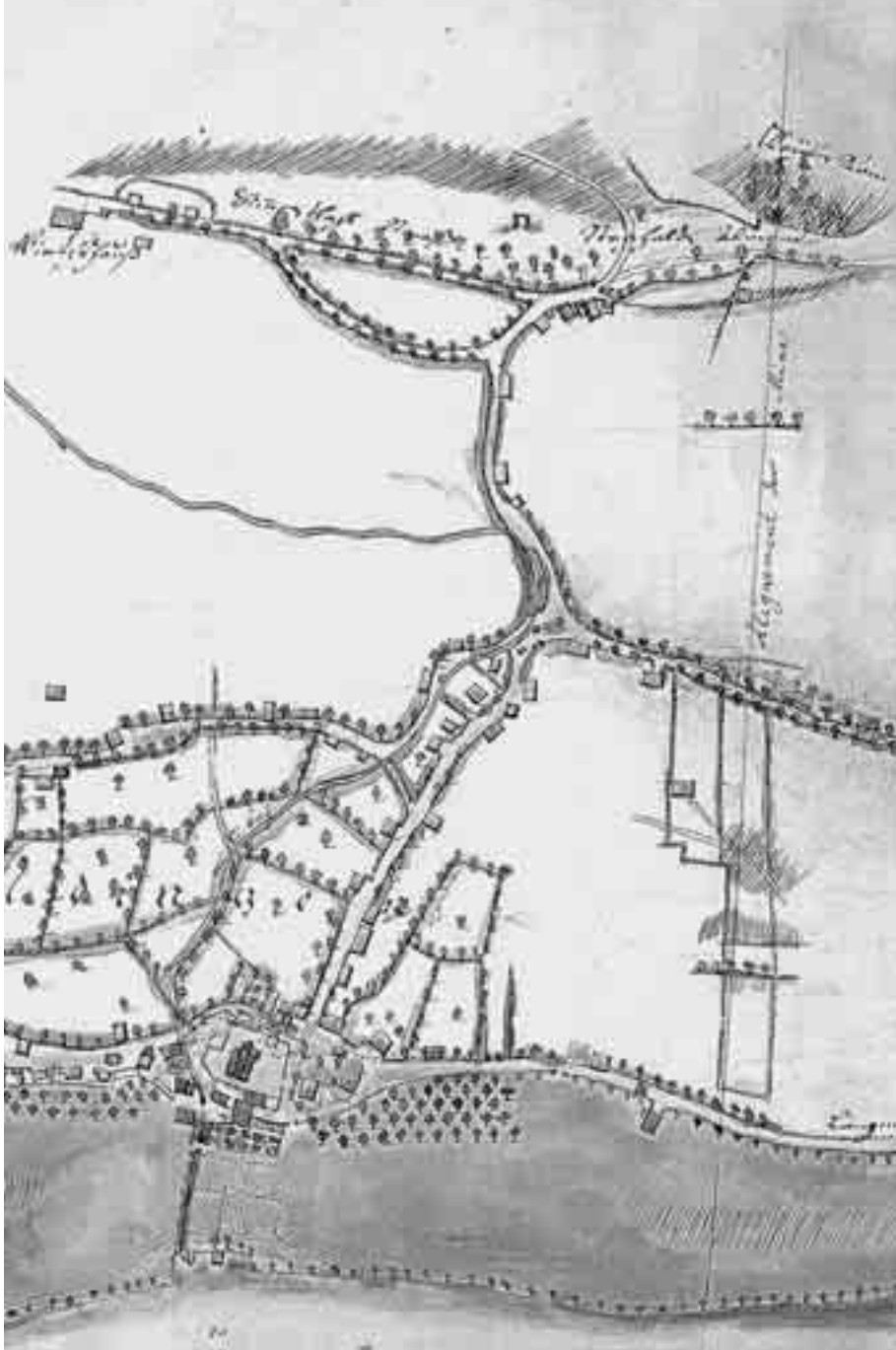
Abb. 4 Die Hochgerichtsstätte der Herrschaft des ehemaligen Chorherrenstifts Amsoldingen, um 1716 (vgl. Umschlagbild). Über dem Amsoldingensee lag das einstige Herrschaftszentrum der Chorherren mit Stiftsgebäude (Schloss) und Kirche, durch das der Weg vom Oberland nach Bern am Galgen (ganz oben) vorbei und die Steghalten hinunter über den Kandersteg (Brücke) nach Thun und Bern führte. Ein anderer Plan des Geometers Samuel Bodmer von 1710 zeigt den Aufstieg an der Steghalten von der Kanderseite her auf die Höhe des Galgens beim Eintritt in die Herrschaft. Der Galgen als Zeichen der obersten Gerichtsgewalt der lokalen Herrschaft war somit Reisenden von Thun und vom Oberland her sichtbar.