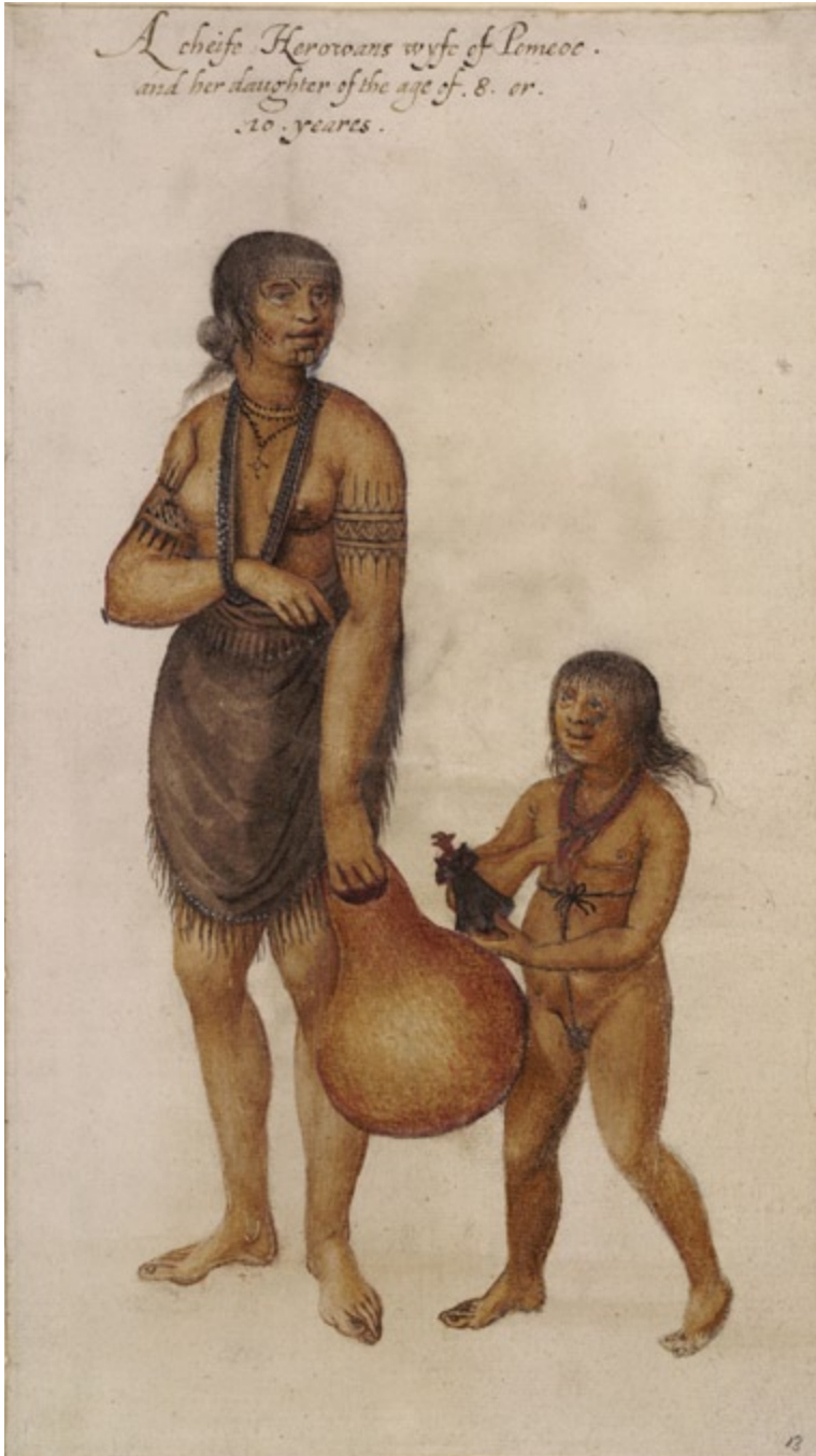
Abb. 13 John White (ca. 1540–ca. 1593) zeichnete bereits im 16. Jahrhundert die Indianer Carolinas. Indian Woman of Pomeiooc, with Child and Doll (ca. 1585) . – British Museum London, Col-P09-e1.