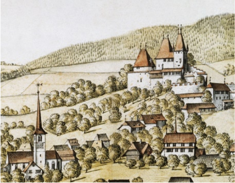
Abb. 2 Die Herrschaft Worb. Albrecht Kauw, 1669. – Historisches Museum Bern, Inv. Nr. 26091 [Ausschnitt].

(1674–1711) eine wichtige Rolle, der als Berater dafür sorgte, dass die neue Kolonie nicht in Pennsylvania, sondern in Carolina entstand.