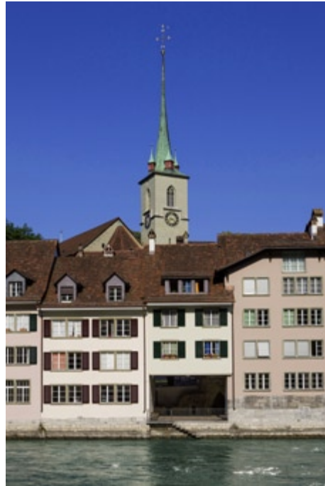
Abb. 7 Das Ländtetor in der Berner Matte diente als Hafen der Stadt und war Ausgangspunkt der Reisen von Graffenrieds.