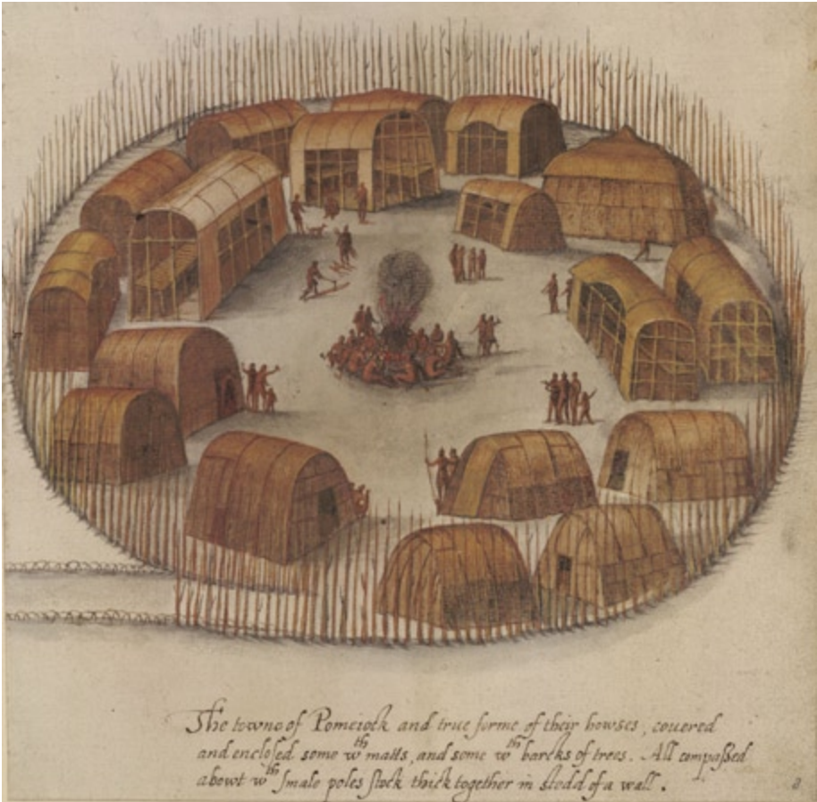
Abb. 14 Indian Village of Pomeiooc (1585), Zeichnung von John White (ca. 1540–ca. 1593). – British Museum London, Col-P09-b2.

«The Indians of North-Carolina are a well-shap'd clean-made People, of different statures, as the Europeans are, yet chiefly inclin'd to be tall. They are a very streight People, and never bend forwards, or stoop in the Shoulders, unless much overpower'd by old Age. Their Limbs are exceeding well-shap'd. As for their Legs and Feet, they are generally the handsomest in the World.» 67