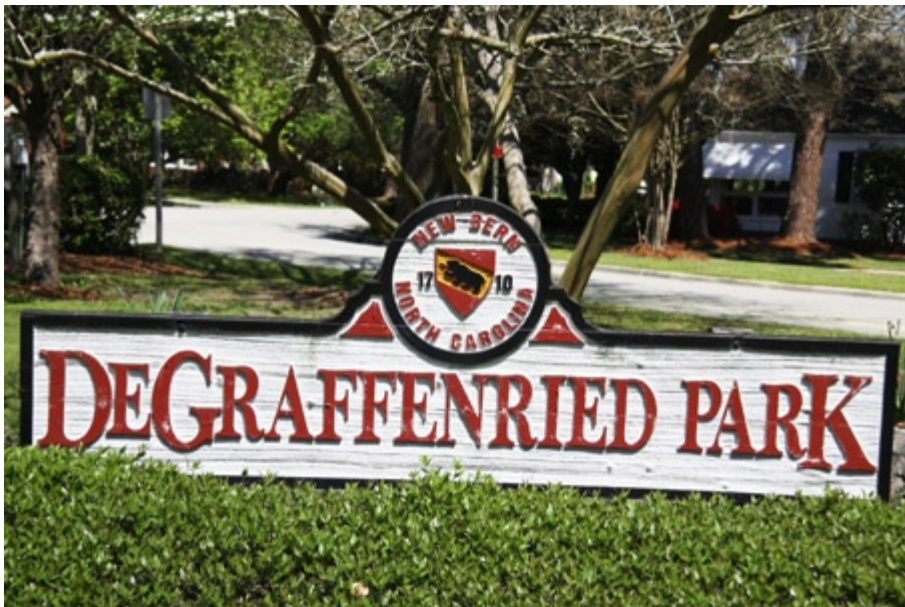
Abb. 15 Sogar ein Park erinnert an den Stadtgründer Christoph von Graffenried. – Tryon Palace Historic Sites & Gardens, New Bern.

Auch wenn die Stadt durch die Indianerkriege beinahe vollständig zerstört und der grösste Teil der Bewohner vertrieben worden war, erlebte New Bern im Verlauf des 18. Jahrhunderts nach seinem Wiederaufbau einen bemerkenswerten Aufschwung. 70 Abwechselnd mit anderen Orten wurde New Bern Hauptstadt des nördlichen Teils der Kolonie Carolina (ab 1729 North Carolina). 1766 machte der königliche Gouverneur William Tryon New Bern definitiv zur Kapitale der Kolonie und liess in den folgenden Jahren den heute noch bestehenden Tryon Palace erbauen. Im Sezessionskrieg spielte New Bern nur eine untergeordnete Rolle, auch wenn North Carolina in