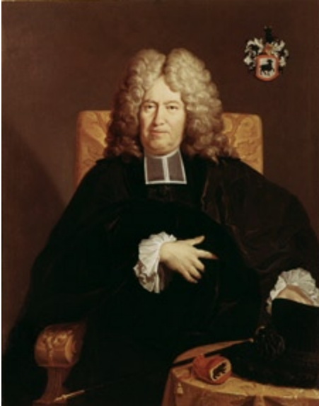
Abb. 5 Der spätere Schultheiss Johann Friedrich Willading (1641–1718) sah in der geplanten Kolonie eine Möglichkeit zur endgültigen Wegweisung der Täufer.