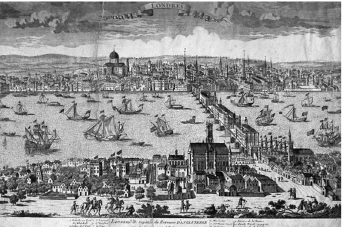
Abb. 8 London um 1700. – The Bridgeman Art Library , Nr. 55994666 [Ausschnitt].

ried, Michel und Ritter, der wohl mit Michel nach London gekommen war, 56 am 18. Mai 1710 den endgültigen «Handlungs-Contract». 57 Am 11. Juli schliesslich waren alle Vorbereitungen abgeschlossen, und die mittlerweile 102 Personen stachen als zweite Expedition in See. Bis zur Abfahrt waren bereits sechs Personen gestorben. Christoph von Graffenried und sein ältester Sohn Christoph (1691–1744) 58 schlossen sich der Gruppe an. Da es damals noch keine hochseetauglichen Passagierschiffe gab, dürften für die Überfahrt umgebaute Handelsschiffe gedient haben, die allerdings mit Kanonen bewaffnet waren. Der spanische Erbfolgekrieg war in vollem Gange und neben Freibeutern waren auch Piraten eine ständige Gefahr, was bereits die erste Reisegruppe schmerzlich hatte erfahren müssen. Auf den Schaluppen waren keine Kabinen vorhanden, bloss Schlafgelegheiten und Klappische. 59 Es scheint sich also um eine Art Massenlager gehandelt zu haben. Die Qualität der Verpflegung war dürftig, viele Lebensmittel waren schon nach ein bis zwei Wochen verdorben. Besser hatten es nur jene Passagiere, die sich selbst ausgerüstet hatten. 60