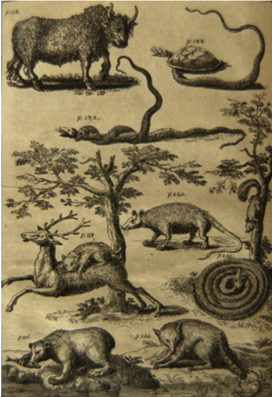
Abb. 6 John Lawson trifft Christoph von Graffenried in London, als sein Werk zu Carolina zum Druck vorbereitet wird. Er beschreibt neben Land und Leuten auch Flora und Fauna. Lawson, John, A New Voyage to Carolina; Containing the Exact Description and Natural History of That Country . London [s.n.], 1709, 117.