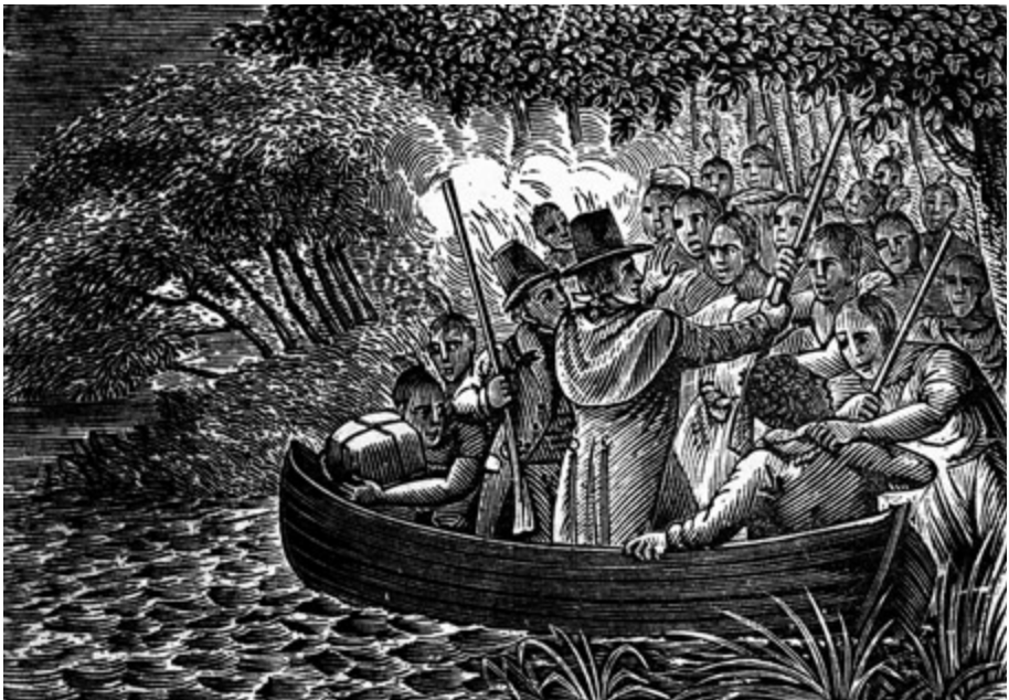
Abb. 10 Von Graffenried und seine drei Begleiter (Lawson und zwei Sklaven) werden von Tuscarora-Indianern gefangen genommen.

Noch immer hat von Graffenried den Traum von reichen Minen nicht aufgegeben. Als er 1711 deswegen mit Lawson eine Schifffahrt ins Landesinnere unternahm, wurden die beiden von den Tuscarora-Indianern gefangen genommen. Die friedliche Nachbarschaft gehörte der Vergangenheit an. Lawson wurde von den Indianern umgebracht, währenddem es von Grafenried gelang, mit ihnen einen Friedensvertrag auszuhandeln und nach mehreren Wochen freizukommen, möglicherweise auch deshalb, weil von Graffenried bereits anlässlich des Landkaufes für New Bern mit den Indianern verhandelt und ihnen eine Entschädigung bezahlt hatte. 63 Im schriftlichen Abkommen wurde nun festgelegt, dass die Kolonie nicht mehr weiter ausgebaut werden solle, die Indianer ihr Gebiet behalten könnten und auch