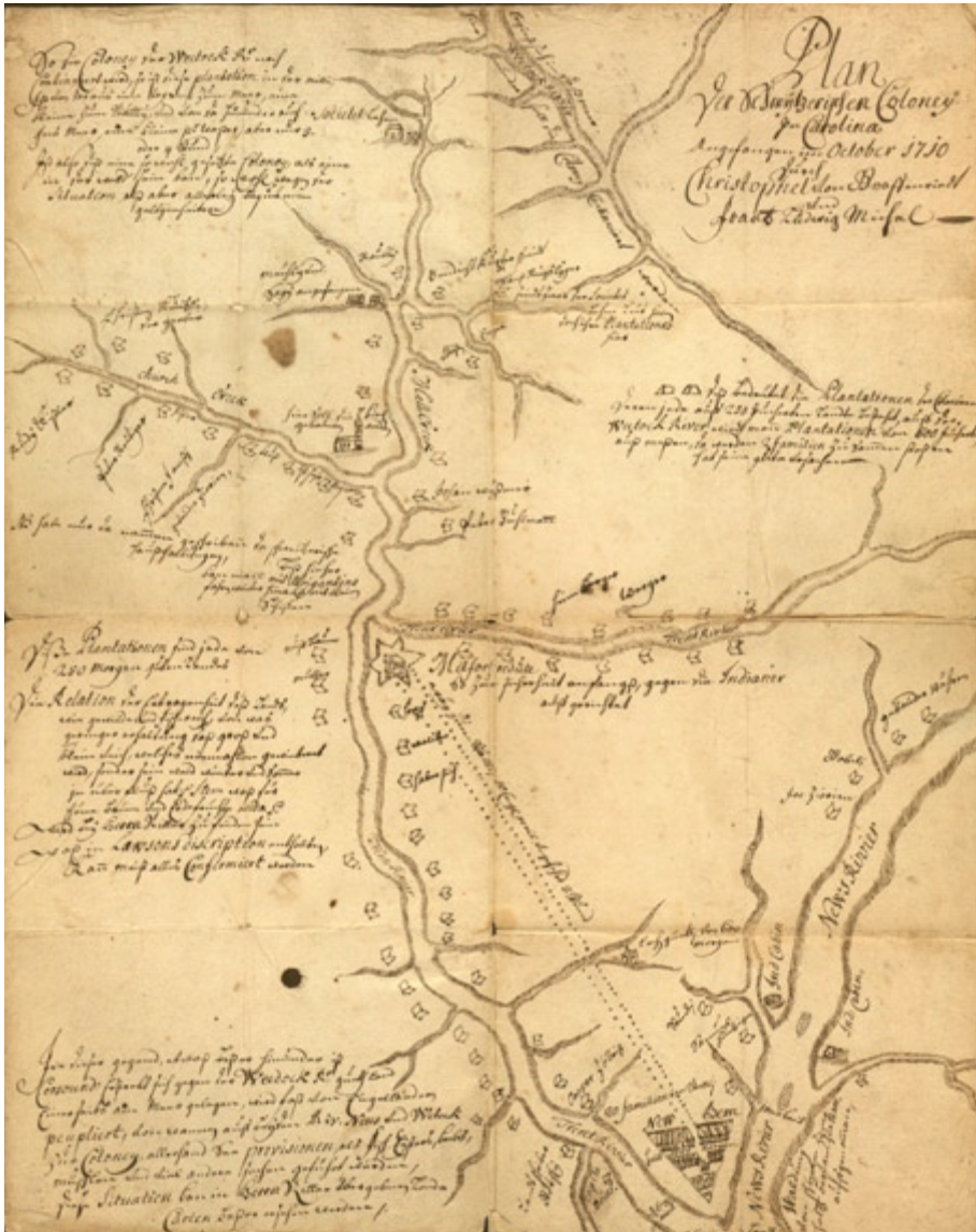
Abb. 9 Christoph von Graffenried und Franz Ludwig Michel erstellten kurz nach der Gründung einen Plan ihrer Kolonie.

Rede) über Land- und Wasserwege der Küste entlang das Gebiet erreichten, wo die Stadt New Bern entstehen sollte. Insgesamt dauerte die Atlantiküberquerung mehr als einen Monat weniger als bei der ersten Gruppe und sie kostete dieses Mal keinem der Passagiere das Leben. Mit dem auf hoher See geborenen Baby kamen 103 Siedler an. 61