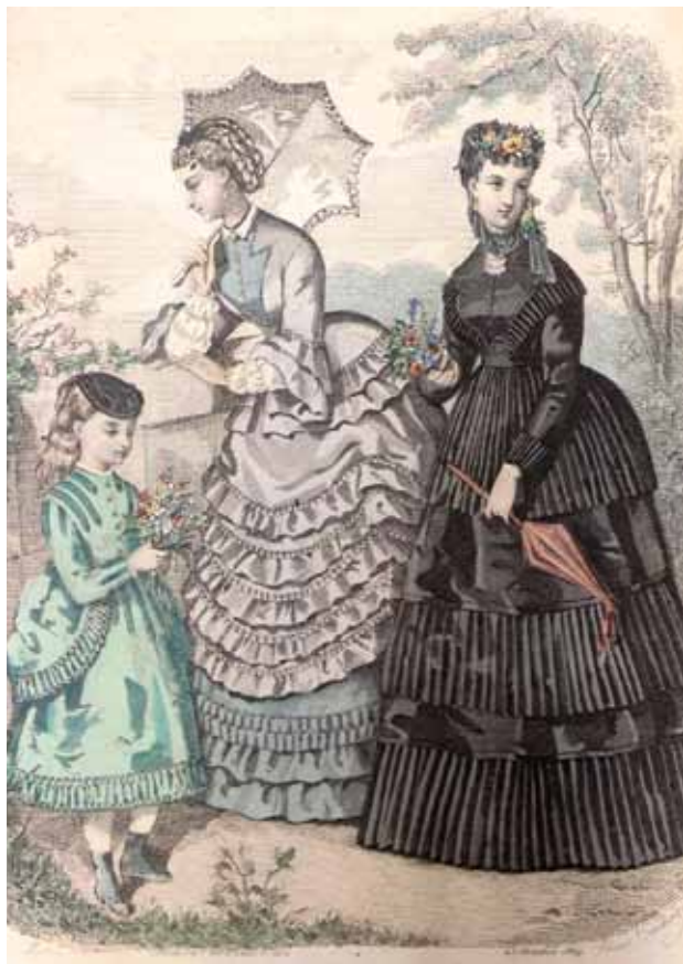
Magasin des Demoiselles, Journal mensuel, Laffitte Paris, 25. Oktober 1869, handkolorierte Grafik, 26 x 16,5 cm. – Privatbesitz.