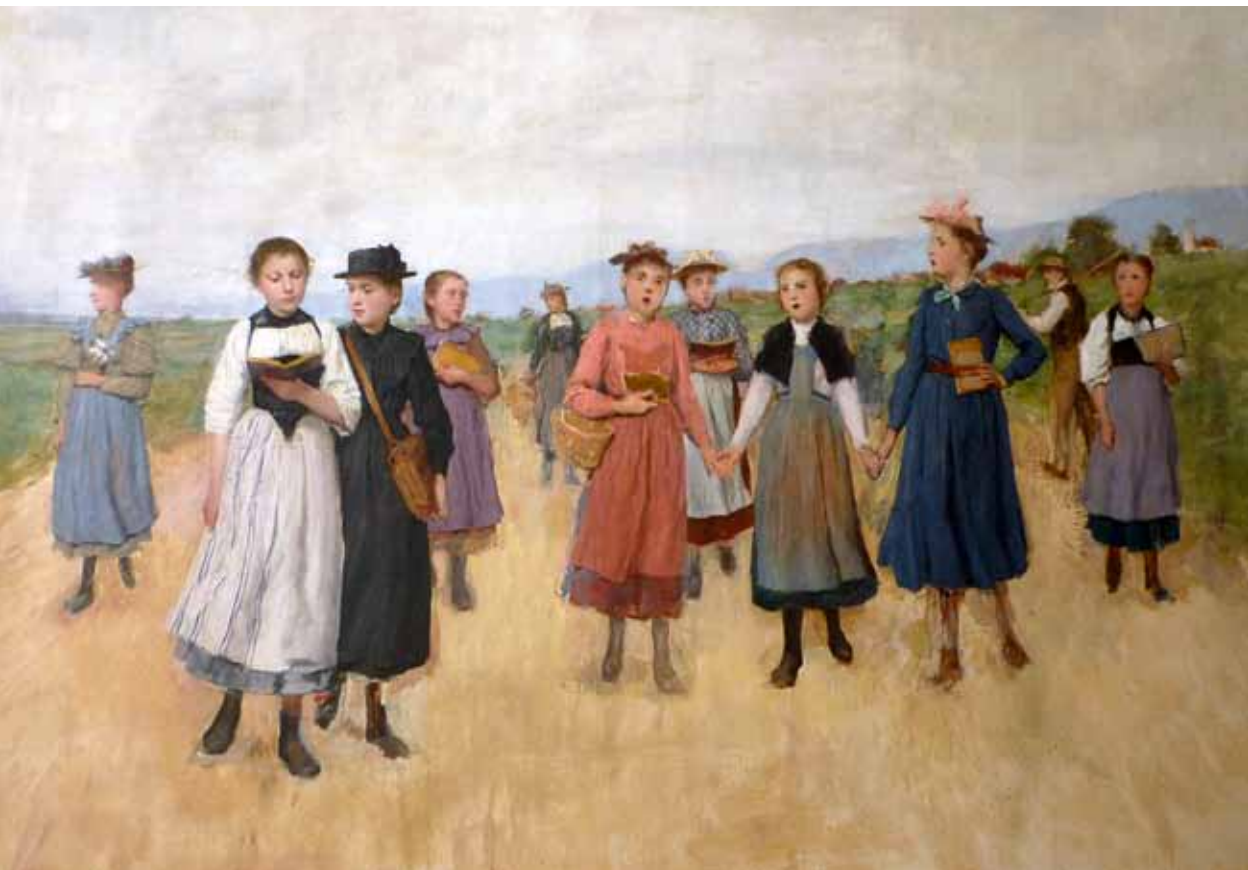
Albert Anker, Die Konfirmandinnen von Müntschemier, 1901, Öl auf Leinwand, 86x131 cm, Kat. Nr. 584.