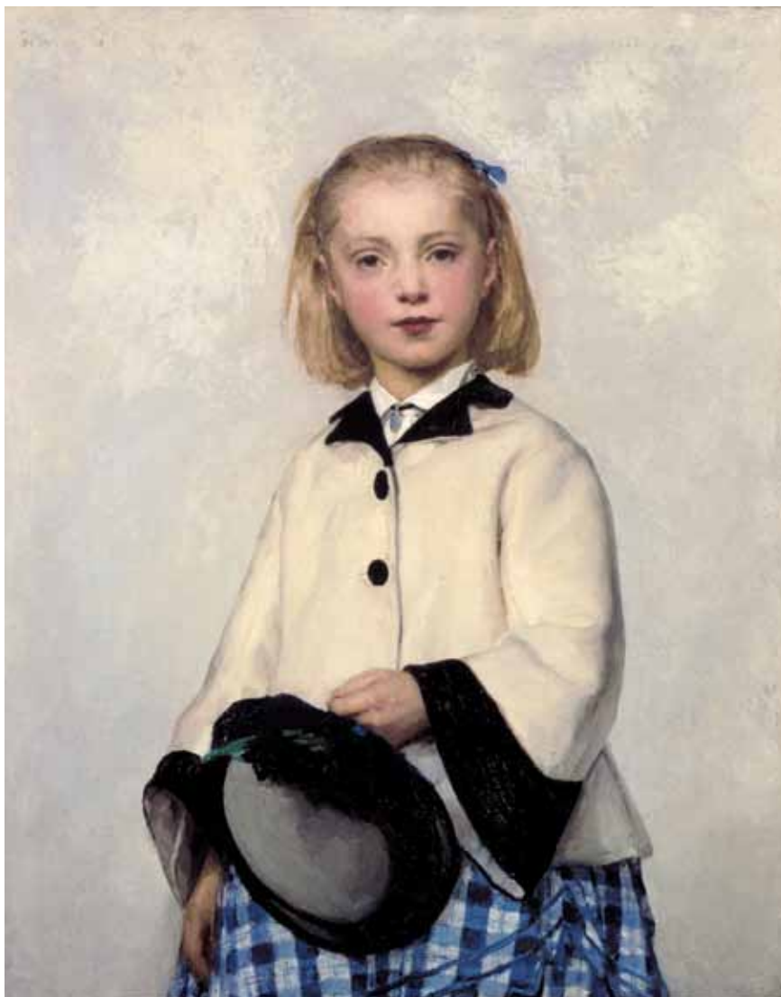
Bildnis Louise Anker, 1874, Öl auf Leinwand, 80,5x65 cm, Kat. Nr. 199. – Museum Oskar Reinhart am Stadtgarten, Winterthur.