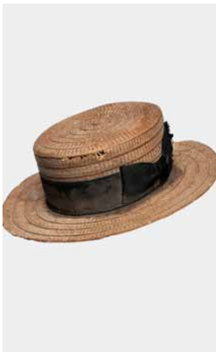
Albert Anker mit Strohhut. [Ausschnitt].

Strohhut mit hoher Kopfform und breiter Krempe. Schwarzes breites Zierband mit Schlaufe, Stempelinschrift: «CHAPELLERIE GEBR. SCHWAB INS-ANET». – Stiftung Albert Anker-Haus Ins.