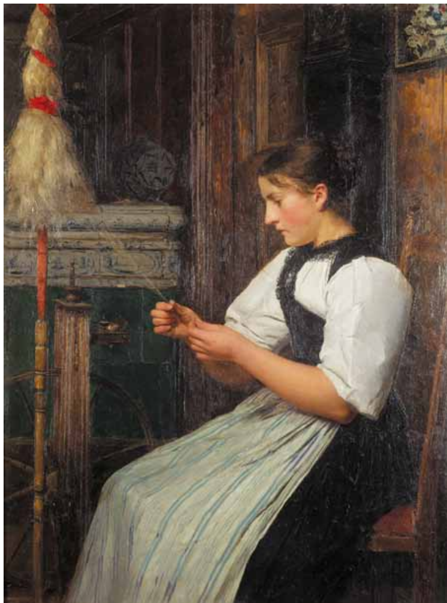
Albert Anker, Junge Frau am Spinnrad, 1884, Öl auf Leinwand, 70,5 x 53,5 cm. Kat. Nr. 321. – Privatbesitz.