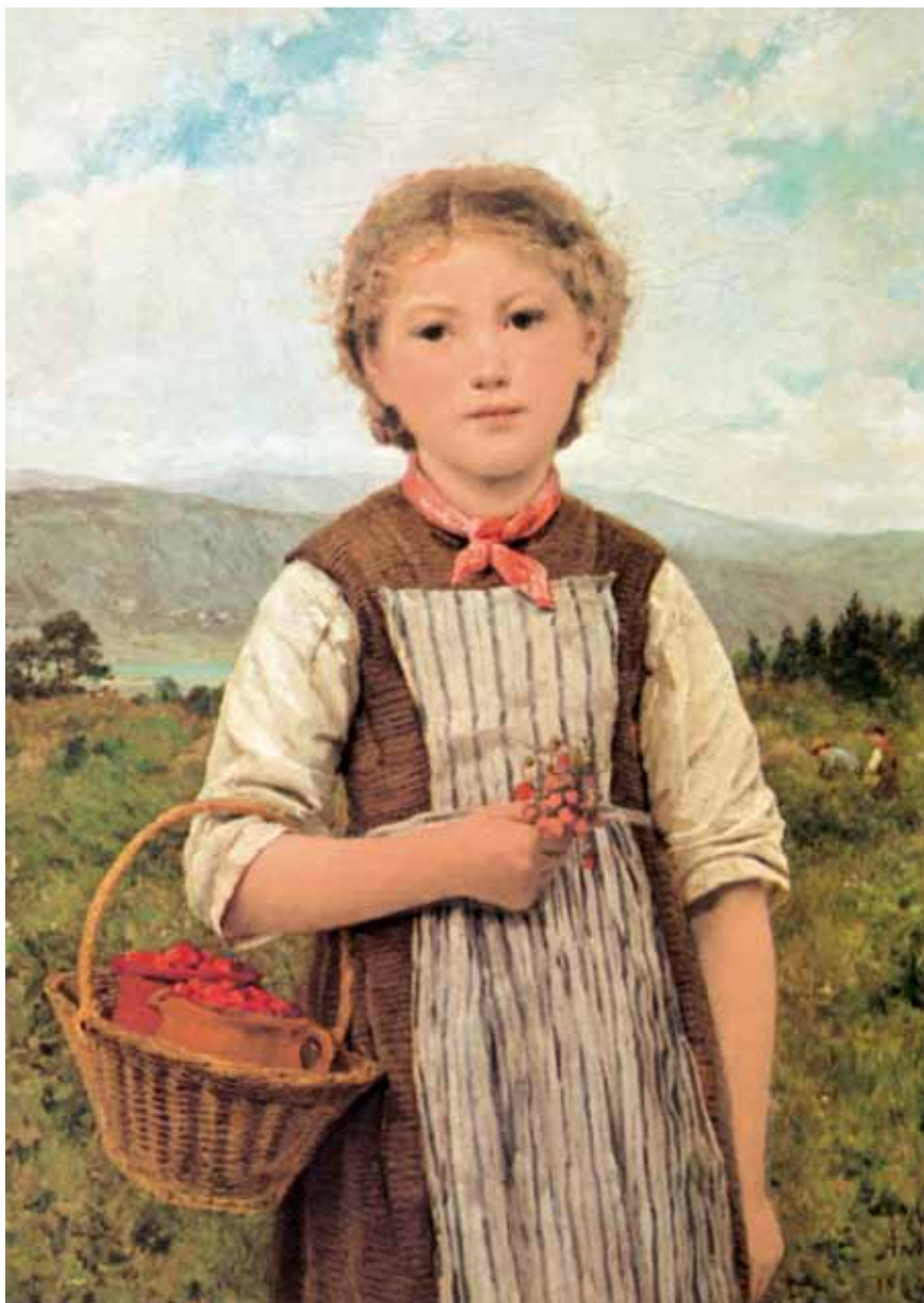
Albert Anker, Erdbeerimareili, 1884, Öl auf Leinwand, 82x60 cm, Kat. Nr. 323. – Musée cantonal des Beaux-Arts, Lausanne.