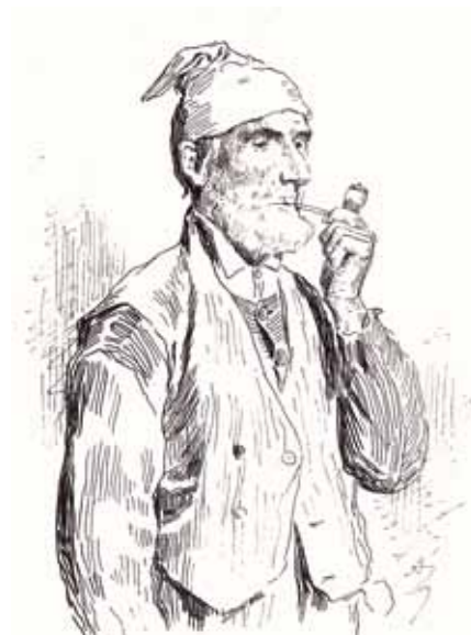
Albert Anker, Pfeife rauchender Bauer I, Illustration in: Jeremias Gotthelf, Die Käserei in der Vehfreude. Verlag Zahn, La Chaux-de-Fonds 1896–1904, 181.