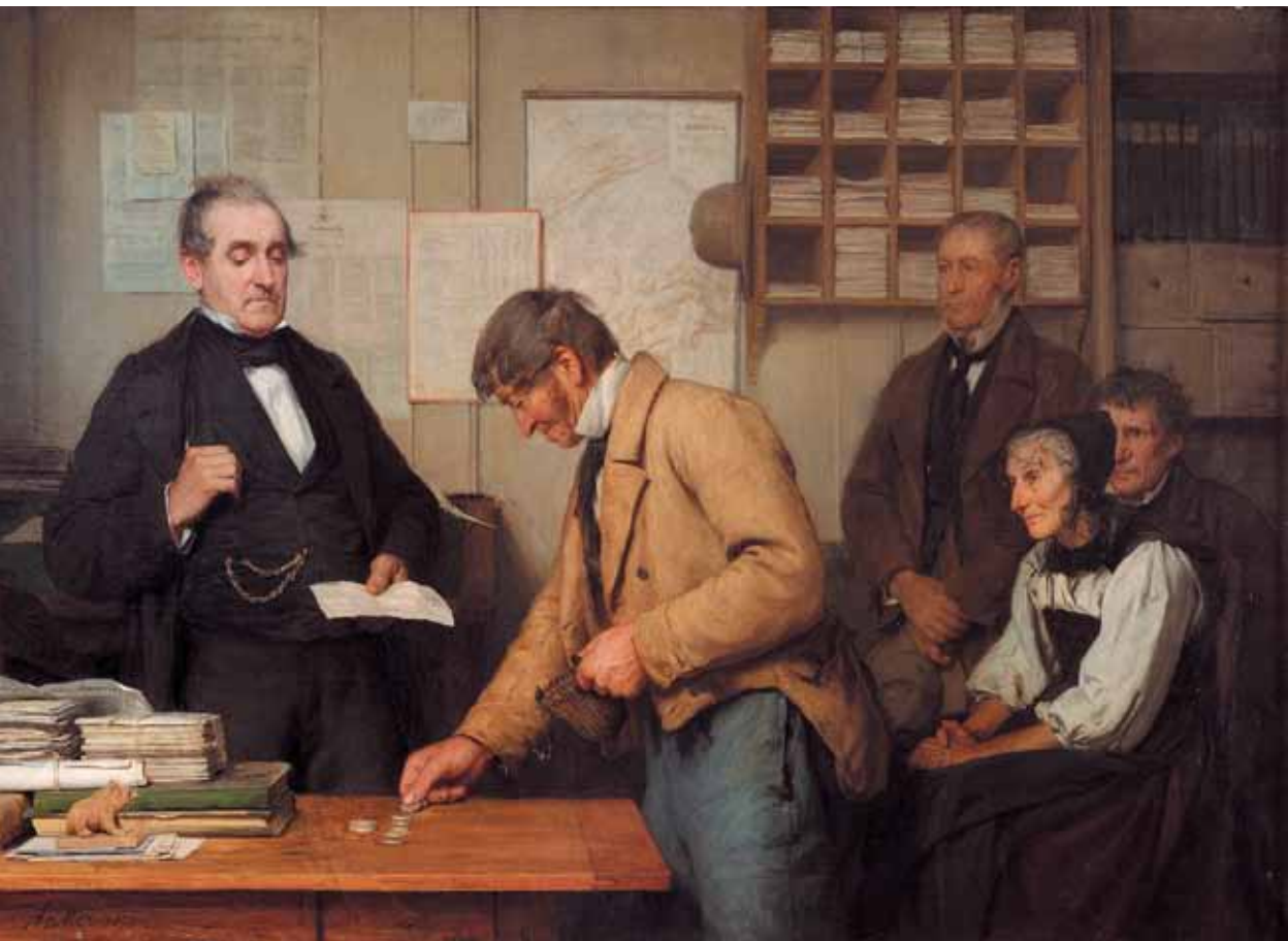
Albert Anker, Der Zinstag, Öl auf Leinwand, 1871, 80,5x117 cm, Kat. Nr. 151. – Privatbesitz.