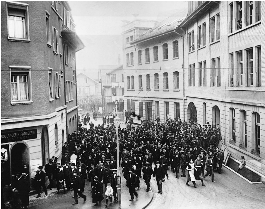
Nach Fabrikschluss, um 1920.

Eigentlicher Motor der Chocolat Tobler war die Belegschaft, ohne deren Einsatz auch die originellsten Produkte, die besten Marketingpläne und die geschickteste Unternehmensleitung erfolglos gewesen wären. Im Verlauf des hundertjährigen Bestehens des Betriebs unterlagen die Arbeits- und Lebensbedingungen des Personals grossen Änderungsprozessen. 1 Einerseits waren die jeweiligen Konjunkturen mit den entsprechenden Absatzmöglichkeiten und die Modernisierung der Arbeitsabläufe für die Arbeitssituation bestimmend. Andererseits hatte die gewerkschaftliche Organisation grundlegenden Einfluss auf die Festlegung sozialpartnerschaftlicher Vereinbarungen.