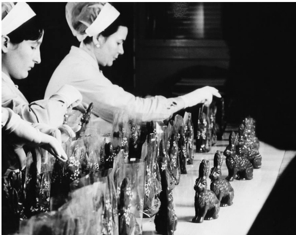
Das Oster- und das Weihnachtsgeschäft bedingten (und bedingen bis heute) Überzeit und Saisonarbeit, Bild aus den 1970er-Jahren.

Die Fürsorgeeinrichtungen waren bereits in den 1920er-Jahren relativ breit ausgebaut. 12 In der Weltwirtschaftskrise und während des Zweiten Weltkrieges arg unter Druck geraten, konnten die betriebsinternen sozialen Institutionen in den 1950er-Jahren weiter verbessert werden. Die Leistungen der 1950 neu organisierten Pensions- und Sparkasse blieben aber bis zur Fusion mit Suchard im Jahr 1970 äusserst bescheiden. Erst die Zusammenlegung der beiden bisherigen Stiftungen von Tobler und Suchard verbesserte die Altersvorsorge nachhaltig. Die Übernahme durch Klaus J. Jacobs in den 1980er-Jahren und später durch Philip Morris bedeutete eine zusätzliche Verbesserung des Pensionskassenwesens.