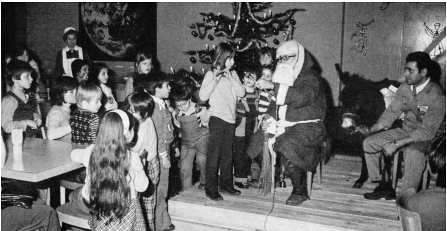
Weihnachtsfeiern für Kinder, hier im Jahr 1974.

meneigenen Verkaufslokal. Zudem publizieren sie das «Senioren-Journal». Die starke Bindung des Personals an das Unternehmen bestand bis in die 1980er-Jahre. Veränderte Arbeitsbedingungen wie unregelmässige Arbeitszeiten und häufiger Personalwechsel erschweren seit dieser Zeit die Ausbildung eines betriebsinternen Zusammengehörigkeitsgefühls und behindern zudem die gewerkschaftliche Arbeit beträchtlich. Demgegenüber ist das Lohnniveau stetig angestiegen, sind die Arbeitszeiten gekürzt und die soziale Sicherheit weiter ausgebaut worden. Der kontinuierlich ausgedehnten Sozialpartnerschaft steht damit der Verlust einer integrierenden Betriebskultur gegenüber.