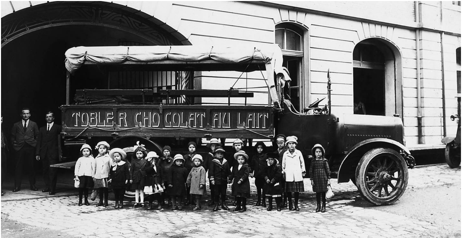
In die Werkverbundenheitspolitik waren auch die Kinder der Belegschaft einbezogen. Die jüngsten Ferienkinder vor ihrer Abfahrt in das fabrikeigene Ferienlager, um 1920.