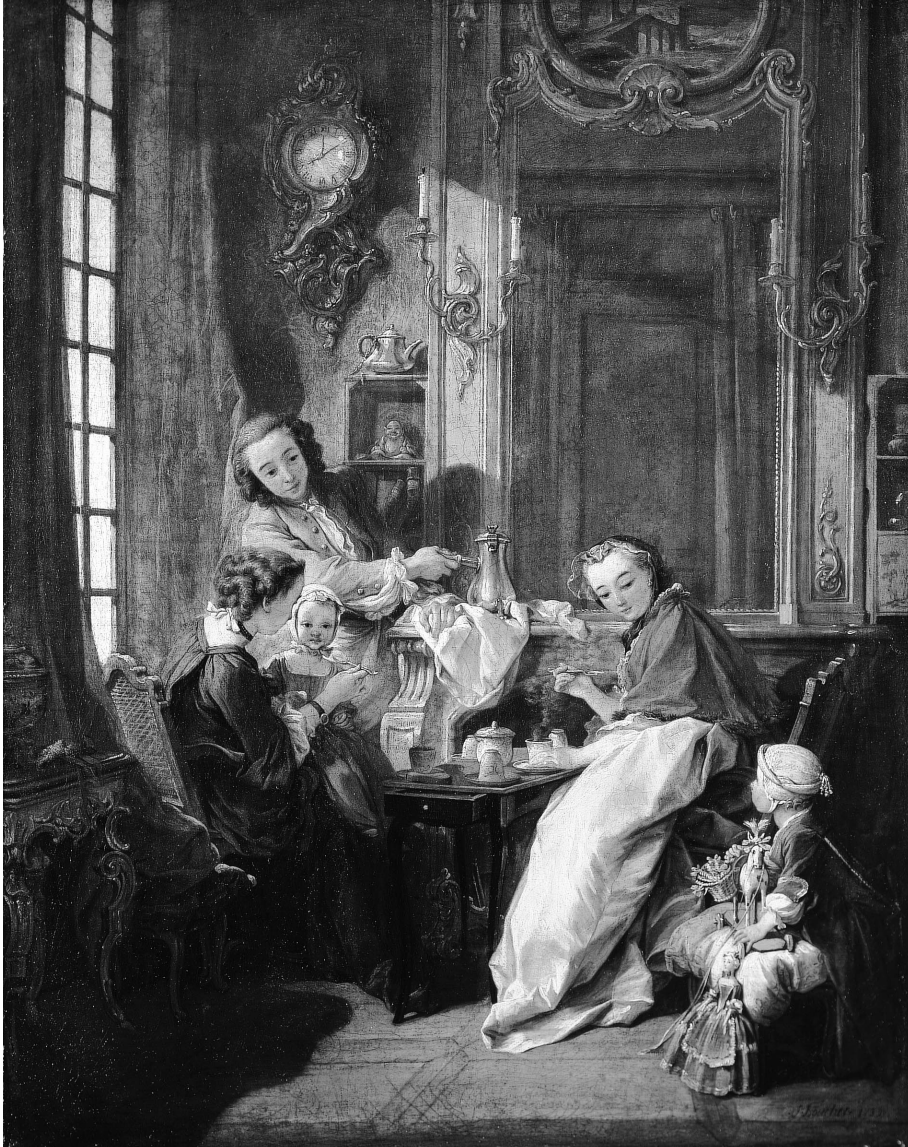
Im 18. Jahrhundert wurde Schokolade ausschliesslich als Getränk konsumiert. Zu dieser Zeit beschränkte sich der Genuss noch weitgehend auf aristokratische Kreise. François Boucher, Le Déjeuner , 1739.