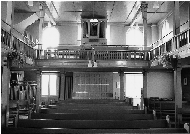
Wesley-Kapelle, Allmendstrasse 24: Innenraum vor dem Umbau. Die Bänke im Erdgeschoss wurden seither entfernt, die Orgel auf der Empore erhalten.

337 Das erwähnte Bad, Vestibül, Decke im Studierzimmer und der Eingriff für den neuen Lift im Entrée.