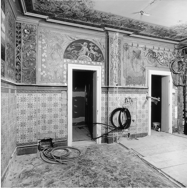
Villa Stein, Schänzlistrasse 19: Das von Otto Haberer vollständig ausgemalte Badezimmer während des Umbaus.

Die VILLA STEIN (Schänzlistrasse 19) wurde 1897/98 vom bedeutenden Berner Architekten Alfred Hodler errichtet. Sie gehörte zu der Gruppe von über 20 zum Teil ausserordentlich repräsentativen Villen, die nach dem Bau der Kornhausbrücke (1895–1898) im nun stadtnah gelegenen oberen Teil des Altenbergs entstanden. Bauherr war der in Ungarn geborene und 1891 von Zürich an die Universität Bern berufene Professor der Philosophie, Ludwig Stein.