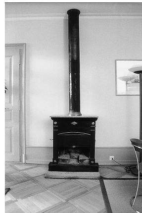
Buristrasse 21: «Cheminée portative» im ersten Obergeschoss des Mitteltrakts.

332 Verloren ist der kleine Salon im Erdgeschoss des Ostflügels, dessen Rück- und Seitenwand zugunsten eines offenen Grundrisses geopfert wurden.