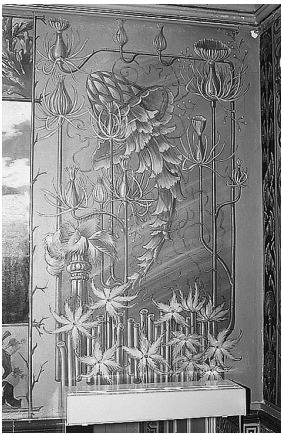
Schänzlistrasse 19: Detail der Grotesken im Badezimmer.

Das Diakonissenhaus entschloss sich 1996, das bisher als Wohnheim für Diakonissen genutzte Gebäude in eine Residenz für Betagte mit 16 Wohneinheiten und den nötigen Gemeinschaftsräumen umzubauen. 336 Die noch vorhandenen Ausstattungen der meisten Räume im Erdgeschoss – mit Ausnahme der Decke im Studierzimmer – sowie diejenigen eines Raums im Obergeschoss konnten restauriert werden. Die Ausnahme, welche die Regel bestätigt, war ein Badezimmer im ersten Stock. Auf einem Rundgang vor Baubeginn wurde dieses einmalige Werk entdeckt, das wertvolle Aufschlüsse auf Bau- und Wohnkultur der Jahrhundertwende ermöglicht. Das Badezimmer ist am Boden und am unteren Teil der Wände vollständig mit farbigen Fliesen belegt. Wände und Decke sind flächendeckend unter anderem mit grotesken Sujets bemalt. Sowohl aus Gründen der Akzeptanz der dargestellten Sujets wie aus wirtschaftlichen Motiven konnte eine Freilegung trotz intensiver Bemühungen der Denkmalpflege nicht realisiert werden. Die Einbau-