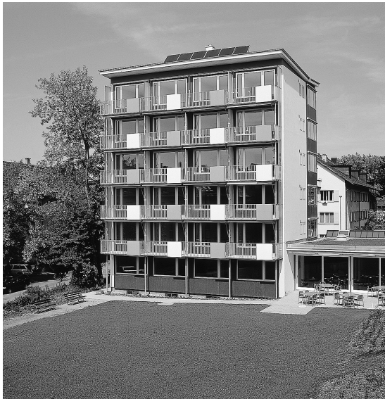
Alterssiedlung Egelmoos, Bürklenstrasse 2: Das «Hochhaus» vor und nach dem Umbau.