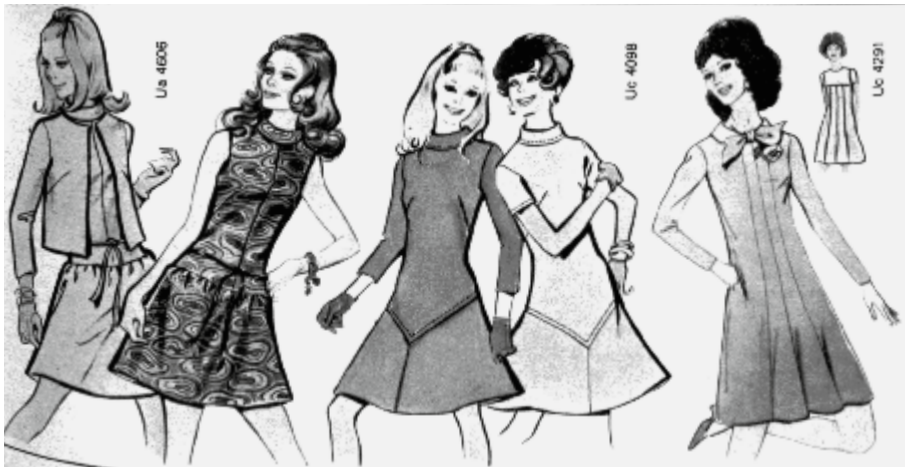
Abb. 13 Ausschnitt aus der Originallegende: «An diesem wichtigen Tag möchte jedes junge Mädchen besonders hübsch aussehen. Das Kleid sollte aber auch später für kleine Parties, Theater- und Konzertbesuche und so weiter noch gute Dienste leisten.» Zeitschriftenauschnitt, Verlags-AG (Hrsg.), Ringiers Unterhaltungs-Blätter. Das Gelbe Heft, Jg. 86, Nr. 8 (21.2.1970.)