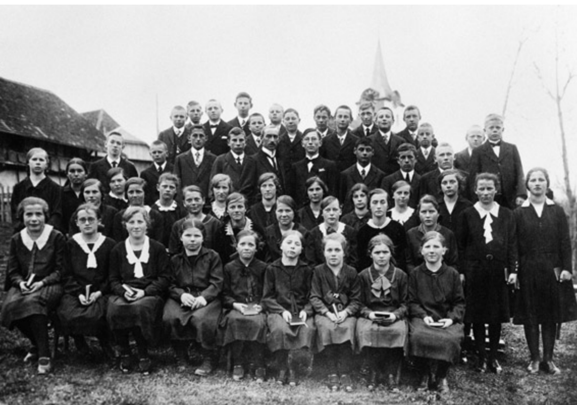
Abb. 3 Die Rüggisberger Konfirmationsklasse 1931 (Jahrgang 1915/16), vermutlich am Konfirmationstag selbst fotografiert. April 1931, Rudolf Zbinden Schwarzenburg. – Archiv Foto Zbinden, Peter Zbinden und Ruth Cläina-Zbinden, Schwarzenburg.

häuser. Die ersten drei Reihen bilden die 29 Konfirmandinnen und in den hinteren drei Reihen stehen die 23 Konfirmanden erhöht. Der Pfarrer, in der Mitte des Bildes, wird von den Konfirmierten umrahmt.