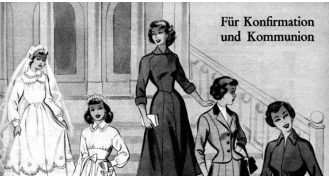
Abb. 7 Schnittmuster des Ringier-Verlags für Konfirmation und Kommunion. Die Konfirmationskleider folgen dem «New Look», bei dem schmale Taille, runde Hüften und ausgeprägte Oberweite betont werden. Zeitschriftenausschnitt, Verlags-AG (Hrsg.), Ringiers Unterhaltungs-Blätter, Jg. 66, Nr. 7 (18.2.1950).

Zur Kleiderwahl der Konfirmanden lässt sich sagen, dass durchgehend klassische dreiknöpfige Woll-Sakkos mit mittlerem Revers, kleiner Einstecktasche und zwei Aussentaschen (Pattentaschen) gewählt wurden. Bis auf vier vermutlich mittelgraue Modelle sind alle Jacketts dunkel (schwarz oder dunkelblau). Die darunter getragenen Gilets/Westen waren nicht aus dem Jackenstoff gefertigt, sondern gestrickt. Solche Strickoberteile sind bei zwölf Konfirmanden zu erkennen, man kann aber davon ausgehen, dass sie von fast allen getragen wurden. Ein Exemplar ist als geknöpftes Gilet zu erkennen und die restlichen elf nur teilweise als ungeknöpft erkennbar. Eines davon ist hell, eines mittelhell und zehn dunkel. Grösstenteils handelt es sich um V-Ausschnitte, wobei zwei möglicherweise über Rundhalsausschnitte verfügen. Die Hemden sind durchgehend weiss mit klassischem Umlegekragen (Kent) und alle Konfirmanden tragen eine Krawatte. Sie war und ist teilweise immer noch das Accessoire des Konfirmanden und macht diesen erst zum vollwertigen Mitglied der Kirchgemeinde. Die Hosen, wie auch das Schuhwerk der Konfirmanden, sind leider nicht sichtbar. Nebst der Krawatte sind folgende Accessoires zu sehen: zwei Krawattennadeln und sechs Ein-