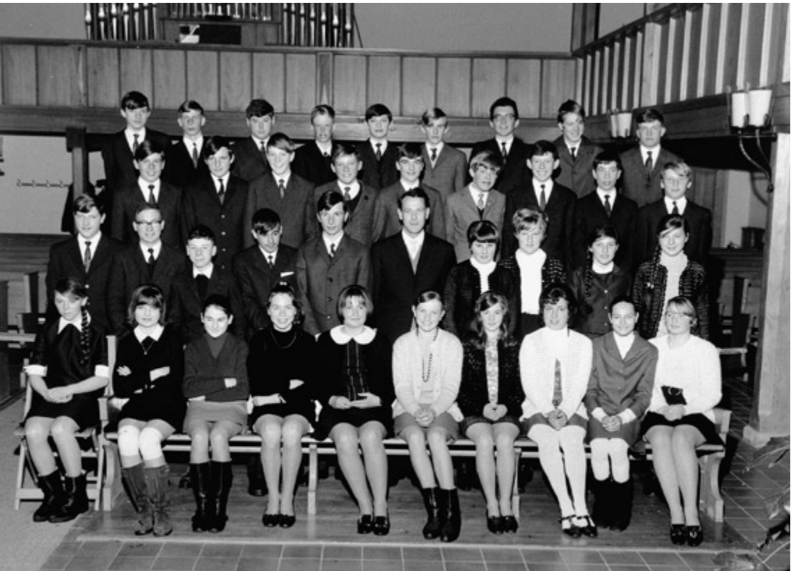
Abb. 10 Das Foto der Konfirmationsklasse 1970 (Jahrgang 1954) wurde im Rahmen der Unterweisung gemacht. Aus diesem Grund sind nicht alle Konfirmandinnen in ihrem Konfirmationskleid abgebildet. März 1970, Robert Zbinden Schwarzenburg. – Archiv Foto Zbinden, Peter Zbinden und Ruth Clalüna-Zbinden, Schwarzenburg.

Wie bei den anderen untersuchten Jahrgängen sind Mädchen und Knaben getrennt angeordnet. In der ersten Reihe sitzen die Konfirmandinnen, die zweite Reihe ist gemischt und steht (fünf Knaben und vier Mädchen neben dem in der Mitte stehenden Pfarrer Gerber), und die dritte und vierte Reihe sind erhöht platziert. Das Bild wirkt weniger homogen als die Aufnahmen von 1931 und 1950, da nun nebst Schwarz und Dunkelblau vermehrt Weiss getragen wird. In der rechten Hälfte der ersten Reihe sticht die Anhäufung von Weiss ins Auge, in der linken Hälfte ist das Bild eher schwarz-weiss dominiert und in der rechten Hälfte der zweiten Reihe überwiegen schwarze Häkel-Jäckchen. Durch die regelmässige Anordnung der Reihen ergibt sich zwar ein einheitliches Bild, dessen Effekt aber durch die Verteilung der Farben und Strukturen abgeschwächt wird.