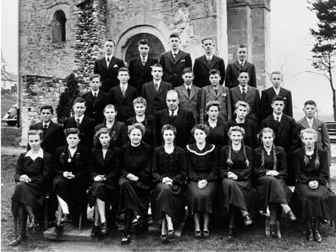
Abb. 6 Die Rüeggisberger Konfirmationsklasse 1950 (Jahrgang 1934), fotografiert vor der Klosterruine. April 1950