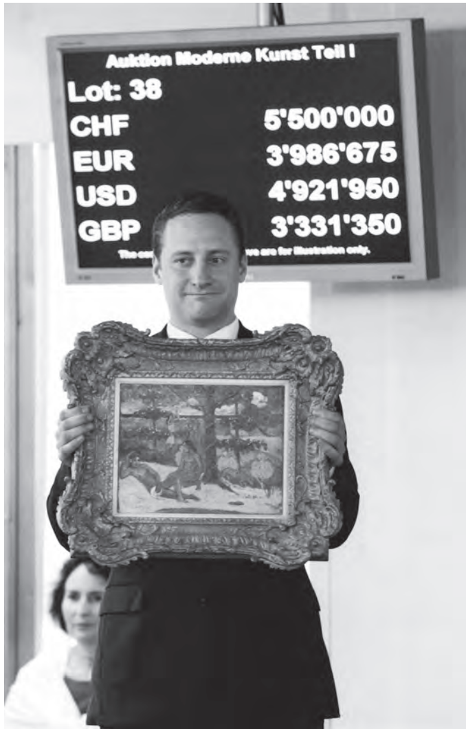
Der Rekordzuschlag von 5,5 Millionen Franken für Paul Gauguins «Scène tahitienne – Te Aarii vahine – Tahitienne royale» am 18. Juni 2010. Damit ist dies das bislang teuerste an einer Auktion der Galerie Kornfeld verkaufte Kunstwerk.