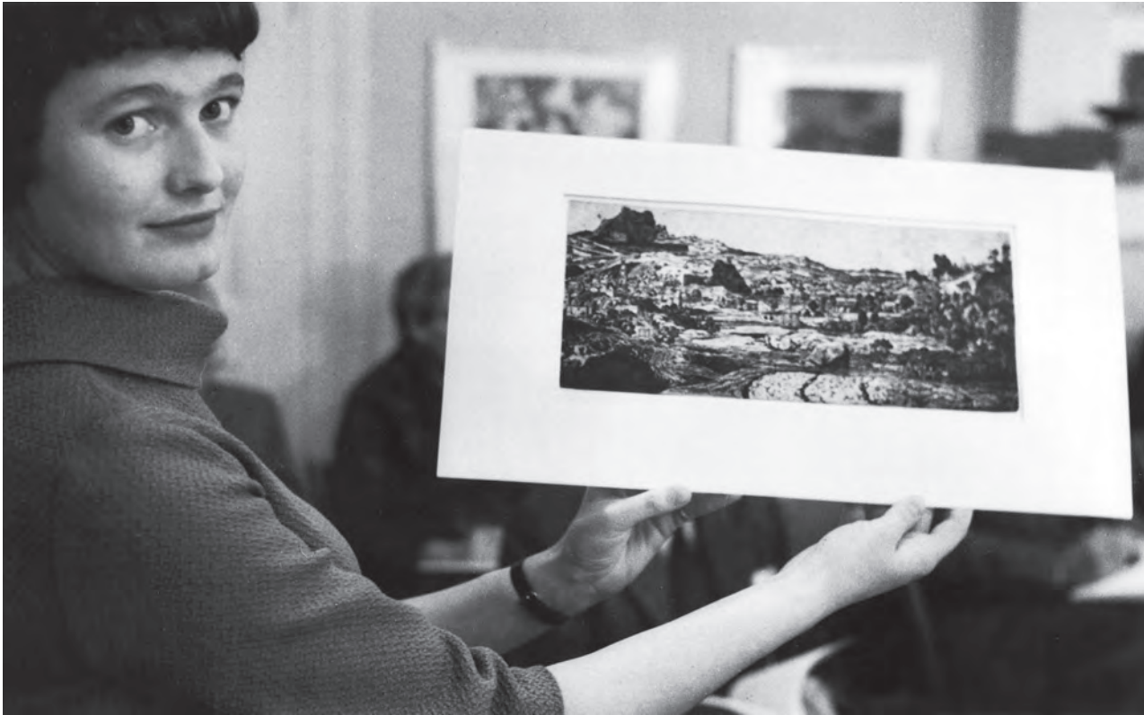
Die zwischen 1615 und 1630 entstandene Radierung von Hercules Seegers «Die Stadt mit den vier Türmen» übertraf 1958 ihre Schätzung um das Sechsfache und erbrachte einen Rekordzuschlag von 122.000.– Franken.