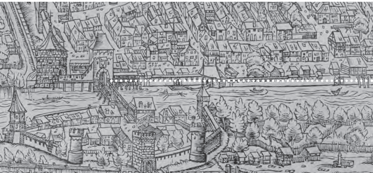
Abb. 3: Ausschnitt aus der Vogelschau der Altstadt Solothurns von Süden (hell gepunktete Linie = rekonstruierte Wasserstandslinie). Holzschnitt in Johannes Stumpfs Chronik nach Vorzeichnung von Hans Asper, 1546, 223.