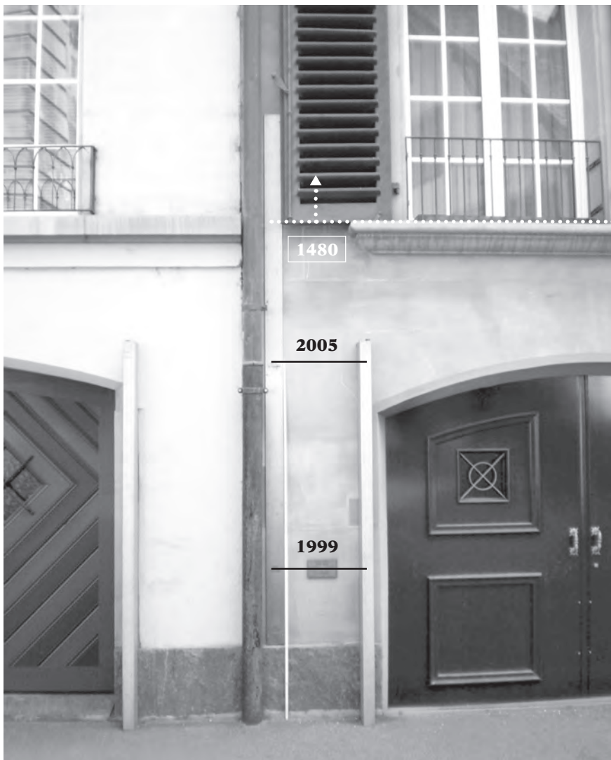
Abb. 2: Hochwassermarken der Überschwemmungen vom 15. Mai 1999 und vom 22. August 2005 an der Gerberngasse 3/5 im Berner Mattequartier im Vergleich mit dem Jahrtausendhochwasser vom 31. Juli/1. August 1480. Bei einem Abfluss von rund 600 m 3 /sec war der Wasserspiegel 2005 als Folge von Stau durch Schwemmholz 1.10 m höher als 1999. Für das Ereignis von 1480 ist dies nicht belegt. Damals schwammen die Möbel im ersten Stock bereits in der Nacht und das Wasser stieg bis zum Mittag weiter.