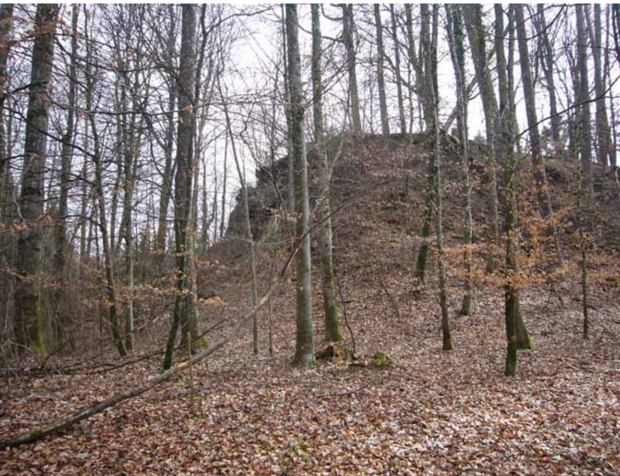
Ruine der Burg Alt-Bubenberg bei Frauenkappelen.