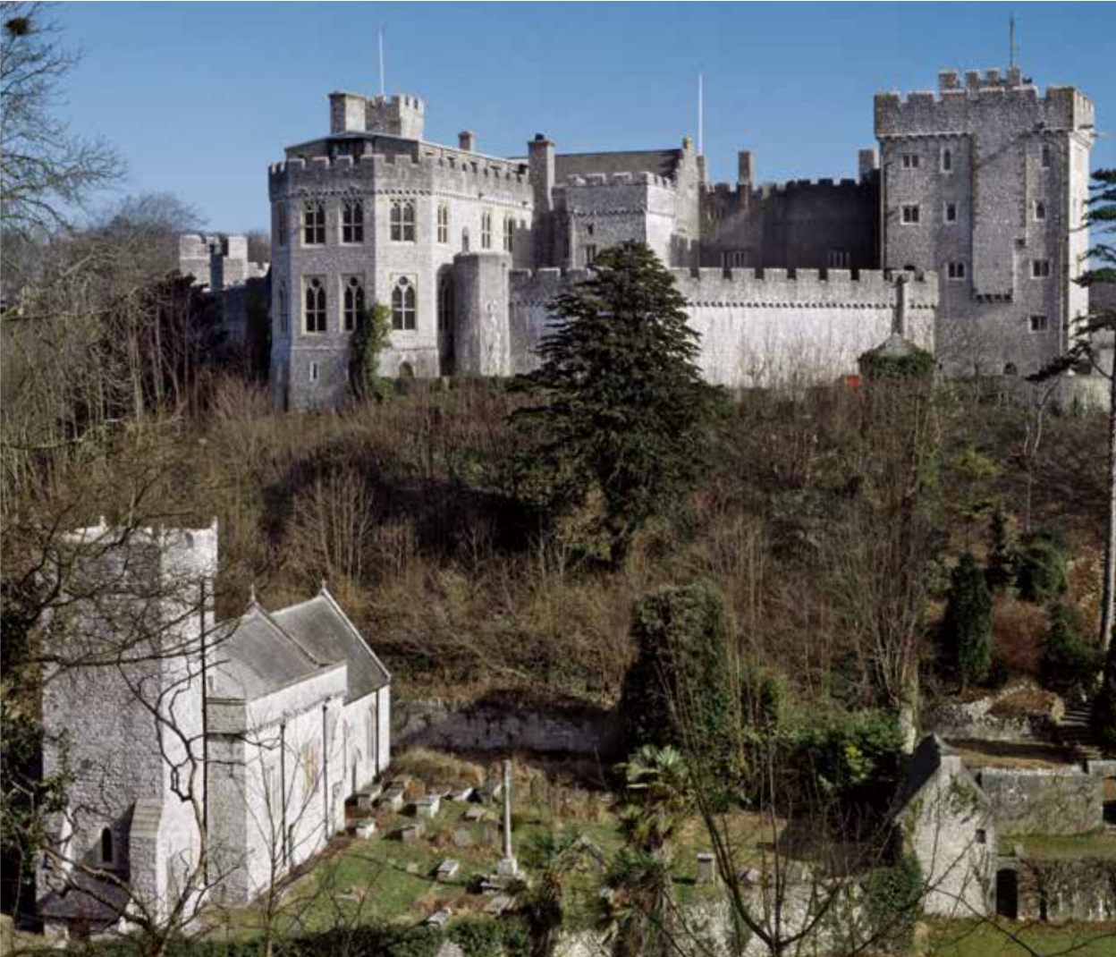
St. Donat's Castle mit Pfarrkirche, Vale of Glamorgan, Wales.