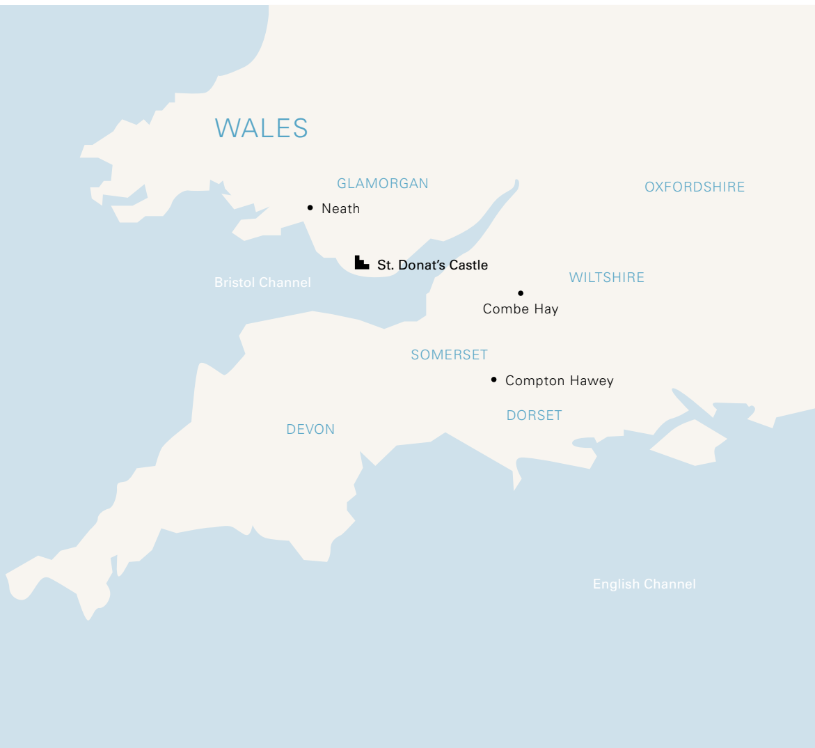
Die Karte zeigt neben der Lage der Besitzungen der Strättligen in Wales und Südengland zu Beginn des 14. Jahrhunderts auch jene von Burg und Abtei Neath. Hervorgehoben ist der Stammsitz St. Donat's Castle in Glamorgan. – Entwurf Christian Hesse, Umsetzung Juliane Wolski.