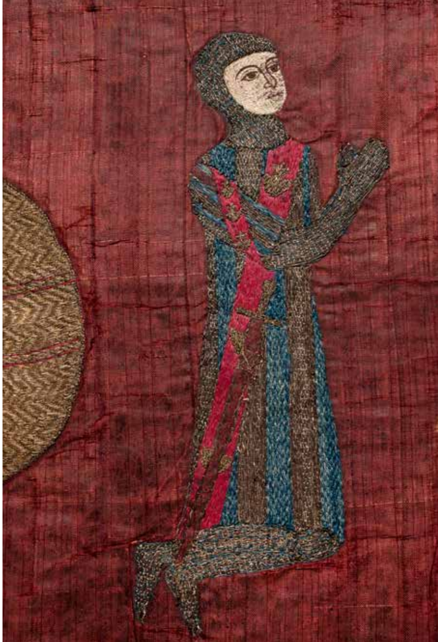
Antependium des Otto von Grandson (Zypern [?] und England, um 1290/1300). Gerüstet und mit umgürtetem Schwert kniet Otto von Grandson vor Maria (auf dem Bild nicht zu sehen). Seine Hände hält er im Betgestus erhoben. Der Waffenrock widerspiegelt das Familienwappen: Rote Querbalken mit Jakobs-muscheln (?) verlaufen diagonal über silberne und blaue Streifen (zum Antependium siehe auch Anm. 31). – Bernisches Historisches Museum [Ausschnitt] .