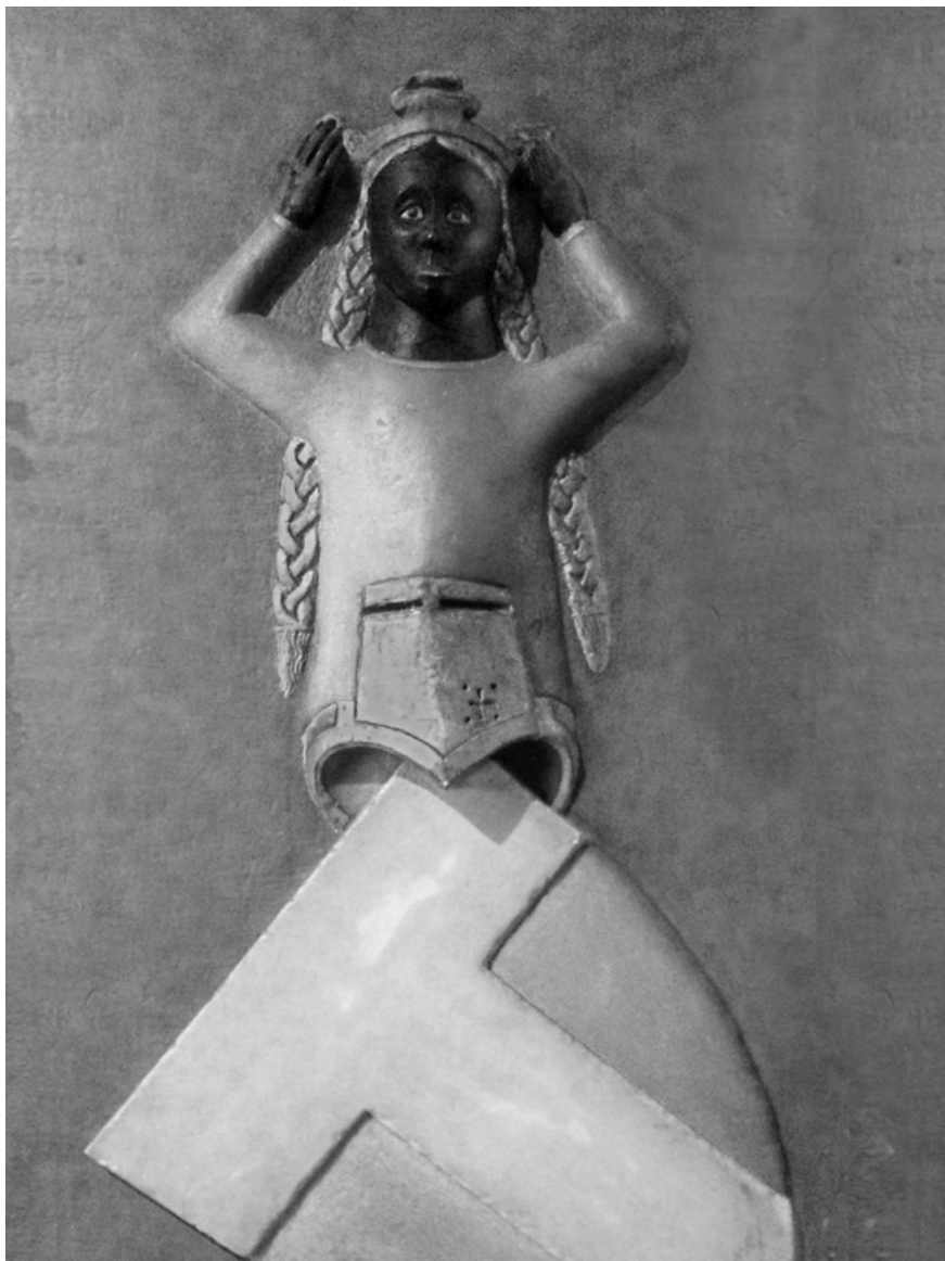
Ausschnitt aus der Grabtafel des Walther Senn von Münsingen in der Französischen Kirche: Kopf einer schwarzen Frau mit goldenen Haaren, Familienwappen mit weissem T-Balken auf rotem Grund (1323).