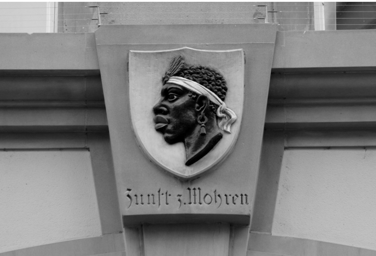
Wappen der Zunft zum Mohren: Afrikaner mit weisser Haarbinde, goldenen Ohrringen und breiten roten Lippen (vermutlich Anfang 20. Jahrhundert). Rückseite des Zunfthauses zum Mohren, Rathausgasse 9.