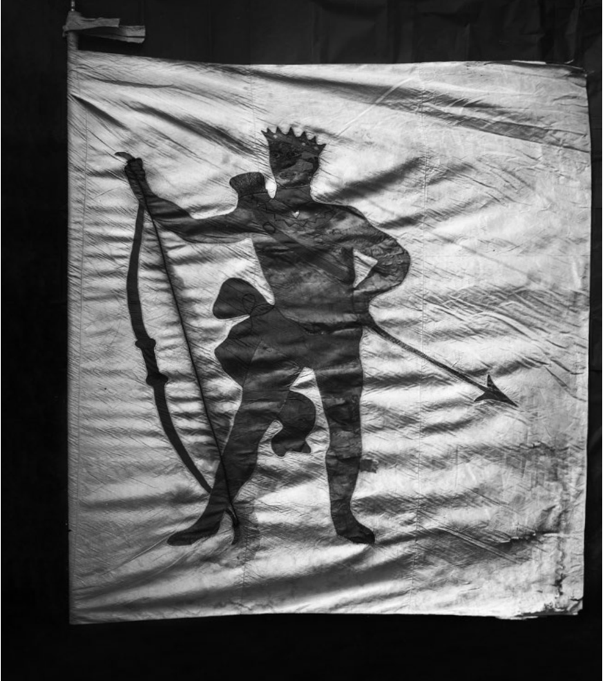
Stubenfahne der Zunft zu Mohren: Schwarzer König mit Krone, Bogen, Köcher, Pfeil und Lendentuch (16. Jahrhundert). – Bernisches Historisches Museum, Depositum (Inv. 8778.1).