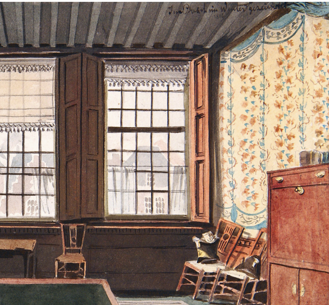
Innenraum der Hauptwache am Marktplatz von 's-Hertogenbosch. – Kolorierte Zeichnung von August von Bonstetten, 1816, 22 x 11 cm. Bürger- bibliothek Bern, EK 2008/400, Privatbesitz.