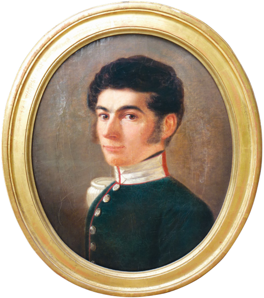
August von Bonstetten, Selbstporträt 1824, Öl auf Leinwand, 38 x 47 cm. – Privatbesitz, Bern.