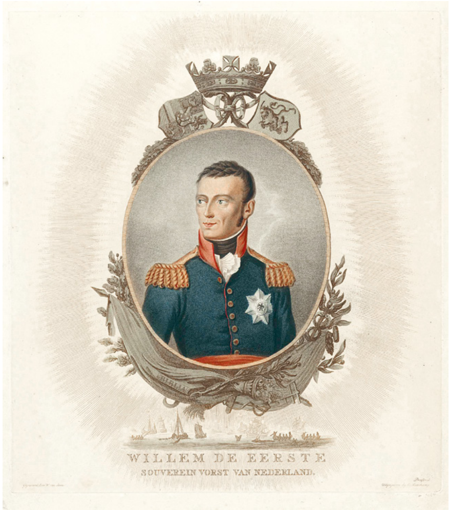
Porträt von Wilhelm I. (1772–1843), König der Niederlande (1815–1840). Druck nach einer kolorierten Gravur von Willem van Senus (1773–1851), 27,4 × 24,5 cm. – Rijksmuseum Amsterdam RP-P-OB_59.411.