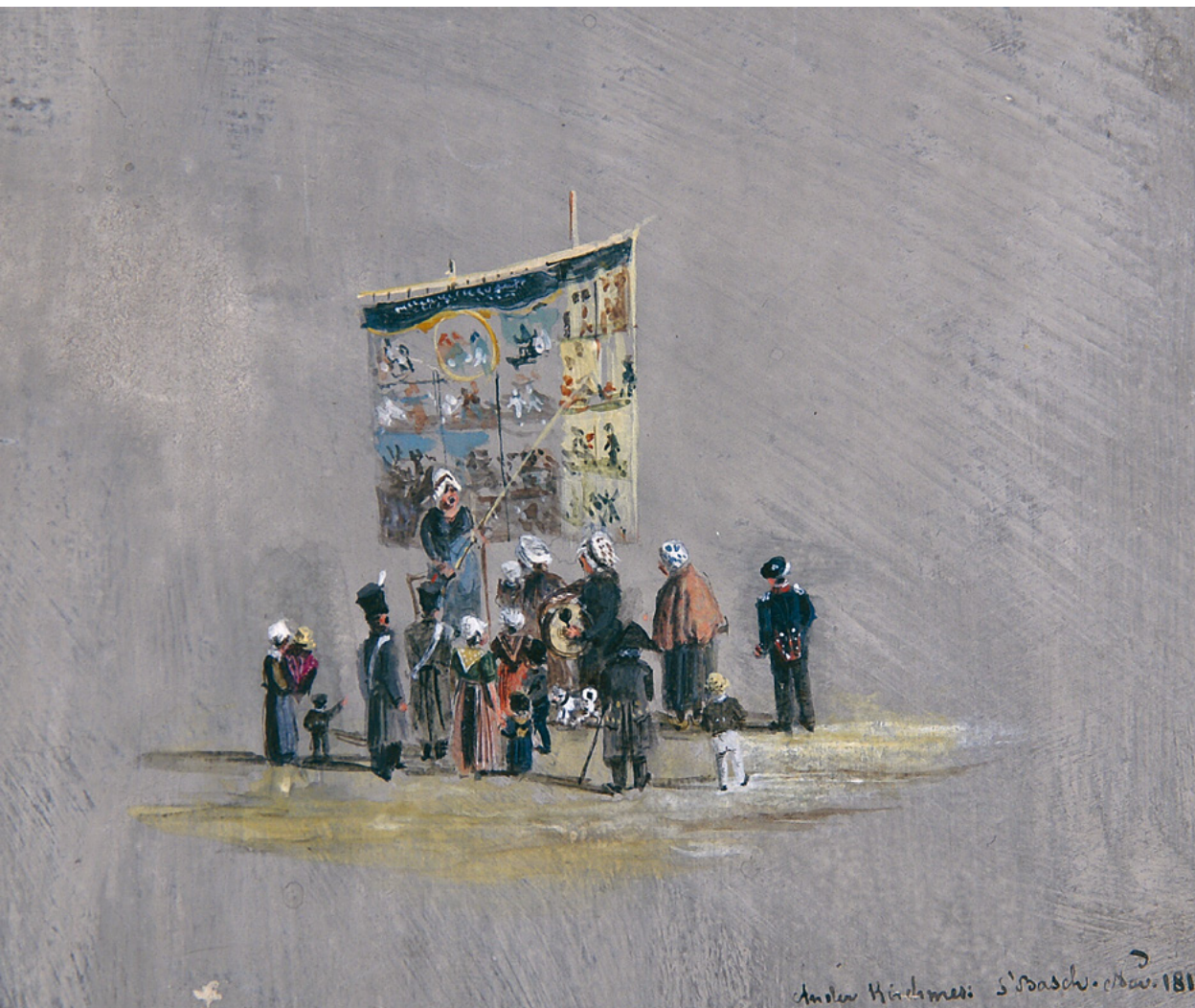
Bänkelsänger auf dem Marktplatz von 's-Hertogenbosch an der Kirmes 1816. – Kolorierte Zeichnung von August von Bonstetten, 1816, 10,5 x 12 cm. Burgerbibliothek Bern, EK 2008/400, Privatbesitz.