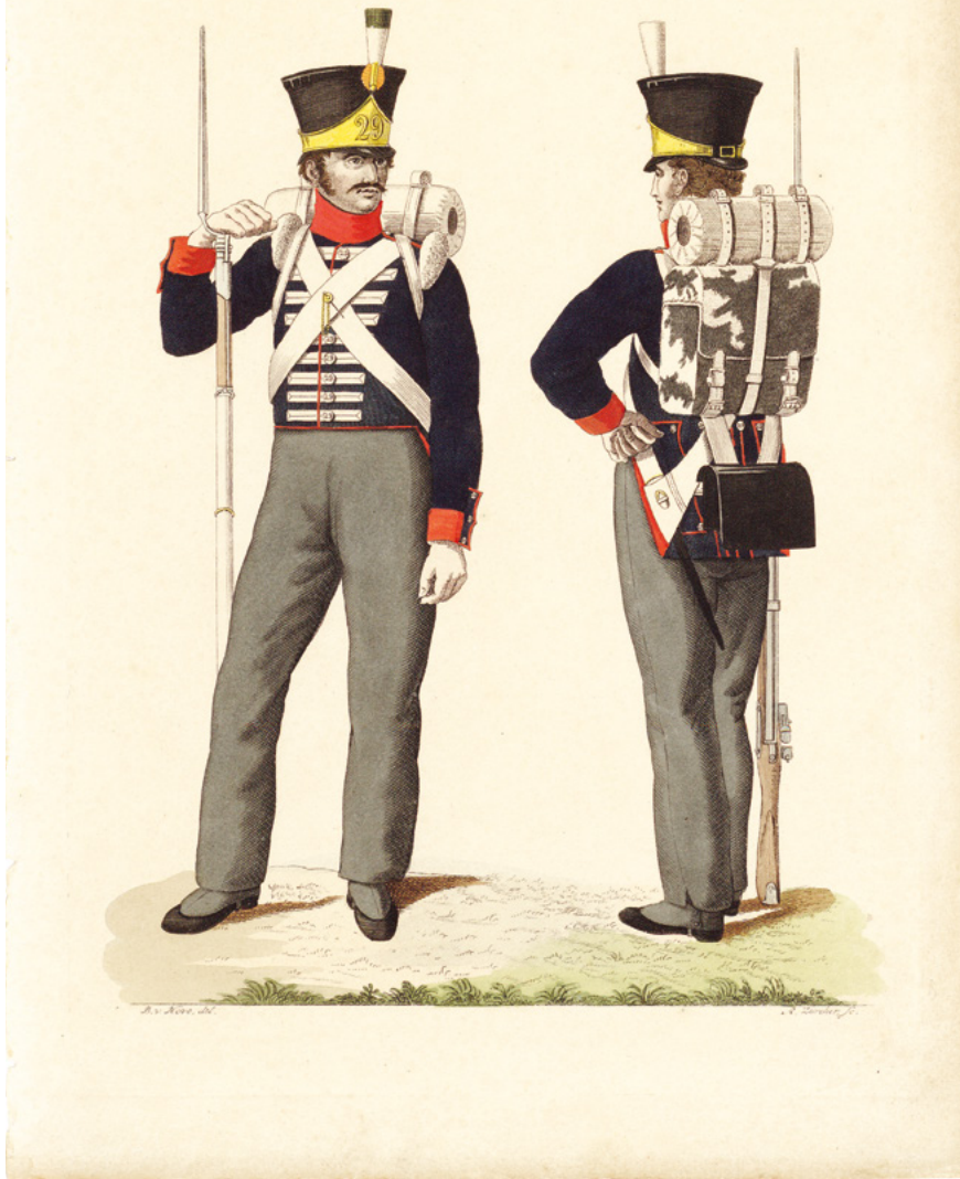
Füsilier und Flankeur (Rückenansicht) des Schweizer Regiments 29. – Zeichnung von Bartholomeus Johannes van Hove (1790–1880), Graveur Antoni Zürcher (1755–1837), 30 × 20,5 cm. Aus: Jan Frederik Teupken, Kleeding en wapenrusting van de Koninklijke Nederlandsche Troepen , 1823 o.O., Nationaal Militair Museum, Soesterberg, Inv.nr. 00116334.