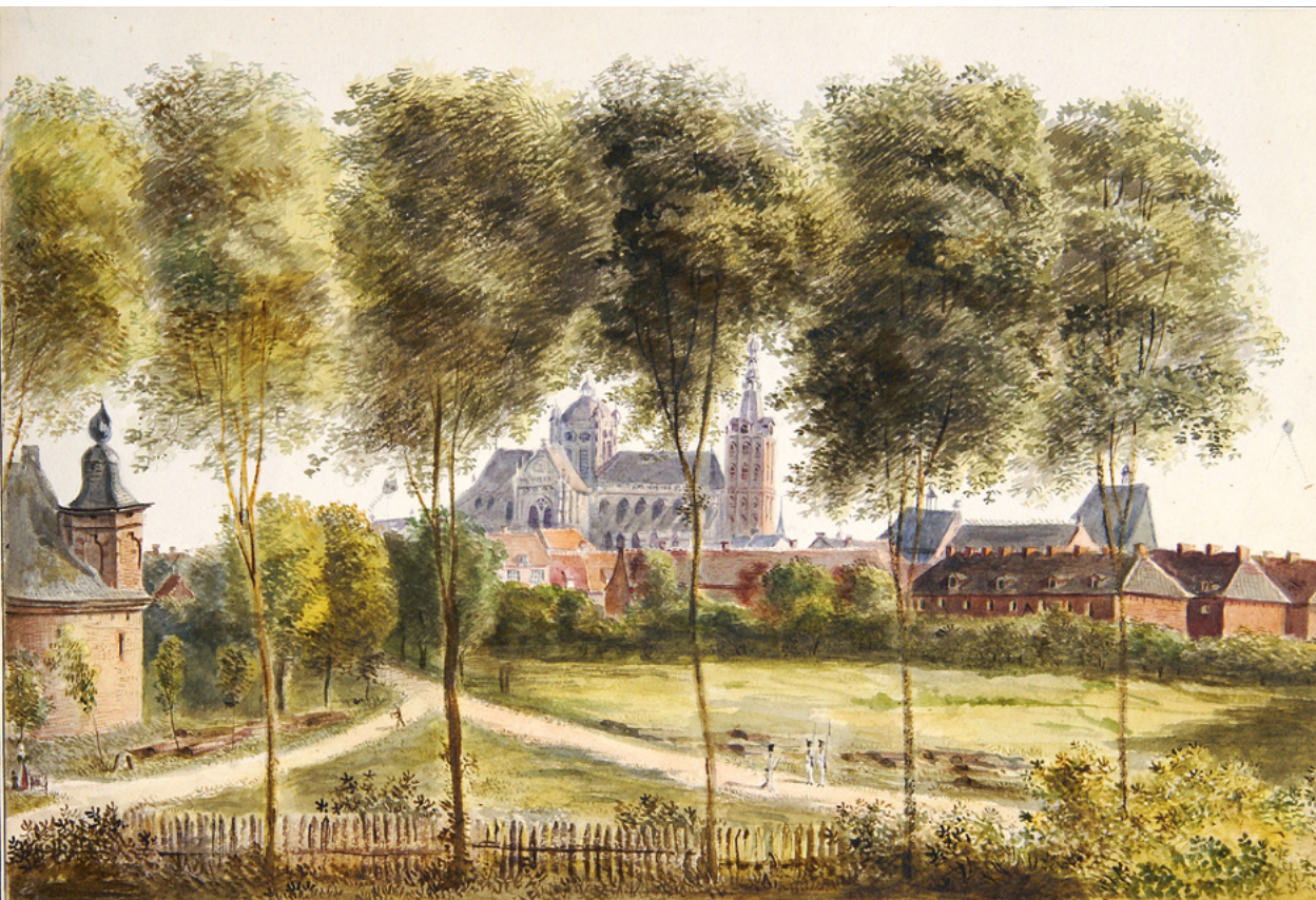
Ansicht von 's-Hertogenbosch (Blick gegen Süden). Im Hintergrund die alles überragende Sint-Jans-Kathedrale, rechts eine der fünf Kasernen (Tolbrugkazerne), ganz links das Pulvermagazin. Auf der grünen Fläche in der Bildmitte, der Plaine, wurde oft stundenlang exerziert. – Kolorierte Zeichnung von August von Bonstetten, 1816, 24 x 16 cm. Burgerbibliothek Bern, EK 2008/400, Privatbesitz.