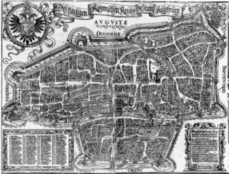
Stadtansicht von Augsburg um 1521 in der Darstellung des Jörg Seld. Holzschnitt (Augsburg, Staats- und Stadtbibliothek).

Erstaunlicher ist diese Zielgerichtetheit in den drei verbleibenden Fällen; sie kann aber mit grosser Sicherheit belegt werden.